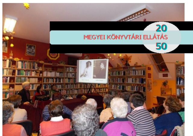
„A nő ezer arca” Olvasásnépszerűsítő programsorozat Zákányszéken