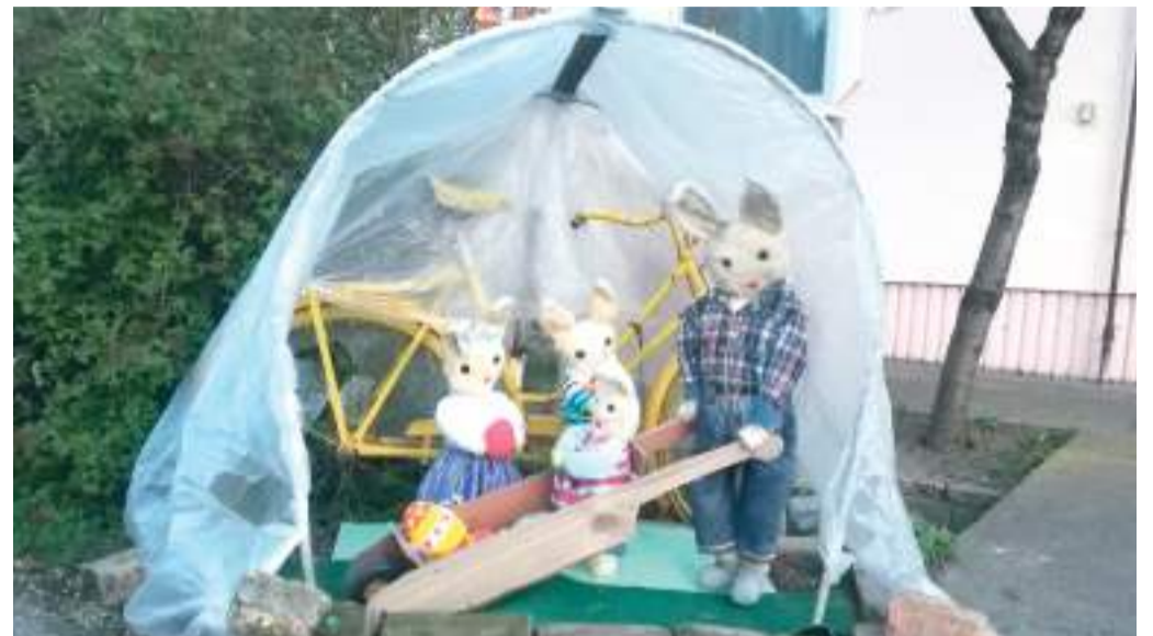
Kedves nyuszikuckót fedezett fel olvasónk a szentmihályi Mikes Kelemen utcában. A húsvéti hajlékba még egy sárga nyuszibicikli is befért.