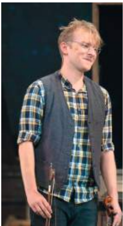
Rádiós A padlásban.