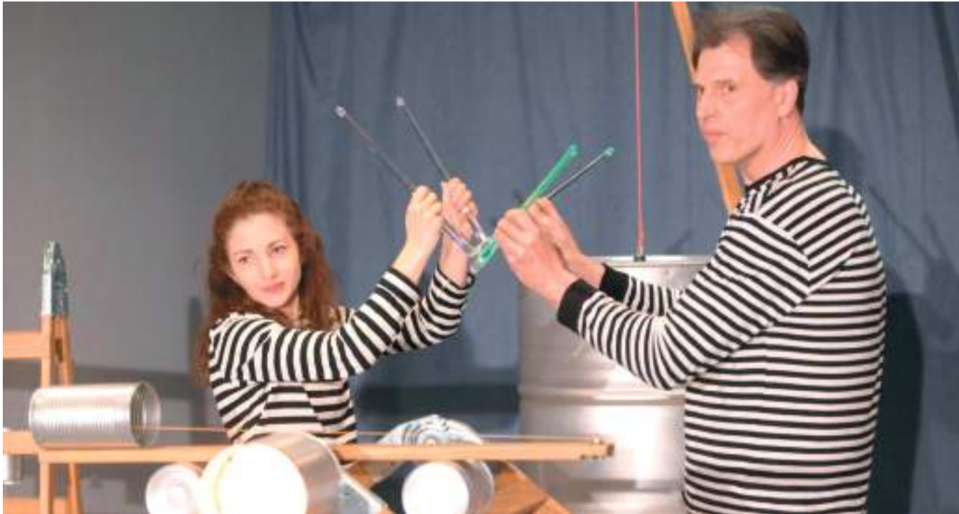
Jelenet az előadásból.