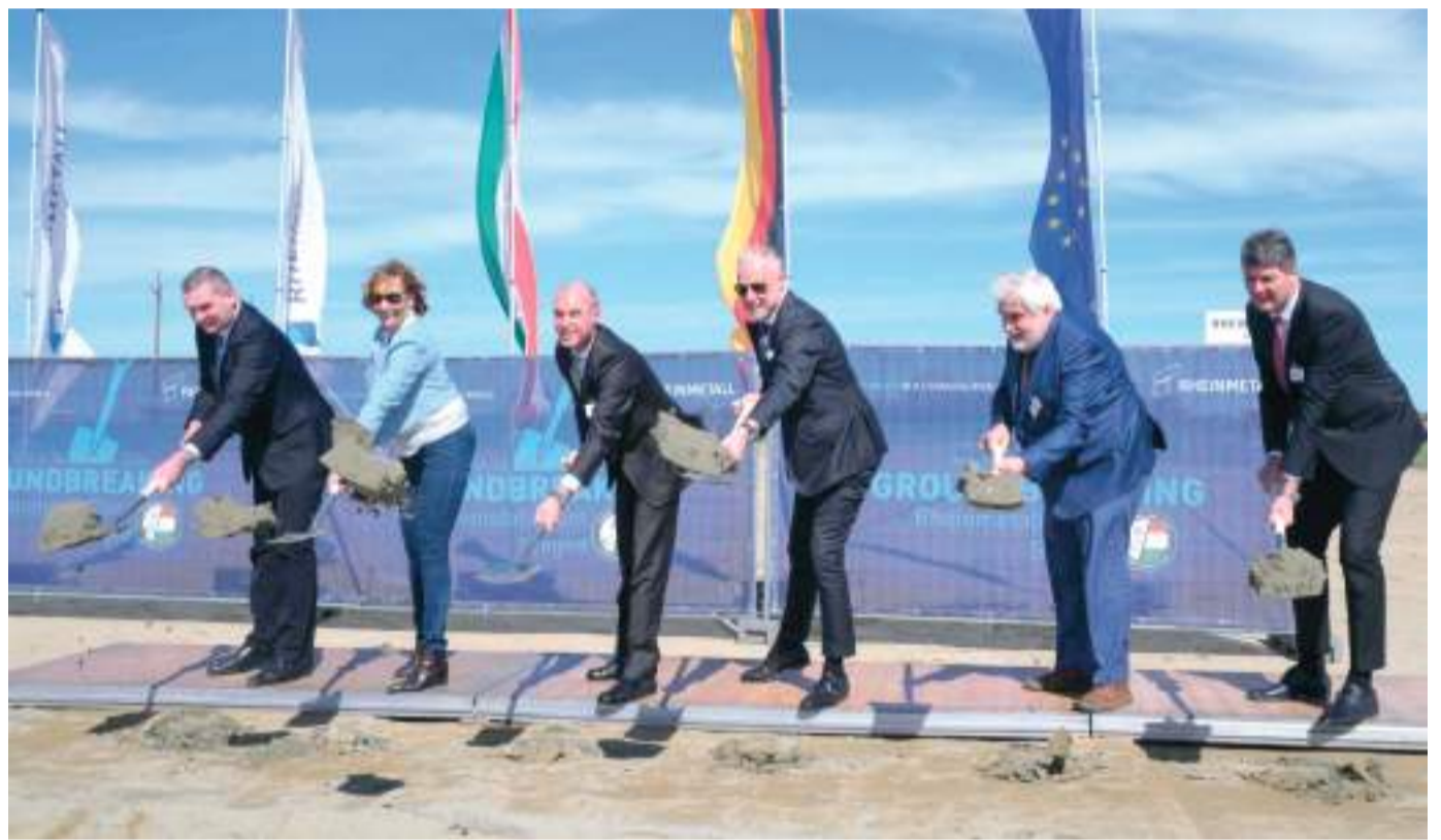
A beszédek után Botka László polgármester, Fendler Judit, a Szegedi Tudományegyetem kancellárja, Christoph Müller, a Rheinmetall Power Systems divízióvezetője, Szalay-Bobrovniczky Kristóf honvédelmi miniszter, Szabó Gábor, az SZTE korábbi rektora, az ELI-ALPS ügyvezetője és Mihálffy Béla országgyűlési képviselő ásólapátot ragadott, és az első ünnepélyes ásónyomokkal, jelképesen elkezdtek építeni a Rheinmetall új, szegedi gyárát.