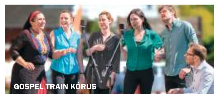
GOSPEL TRAIN KÓRUS