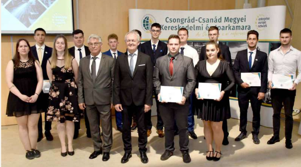
Dobogós helyezésű tanulók közös fotón a kamara elnökével és kézműves alelnökével.

A projekt a Kulturális és Innovációs Minisztérium finanszírozásában valósul meg a Nemzeti Foglalkoztatási Alap képzési alaprésze terhére. A projekt és a Közreműködői szerződés száma: NFA-KA-KIM-6/2023/TK/05.