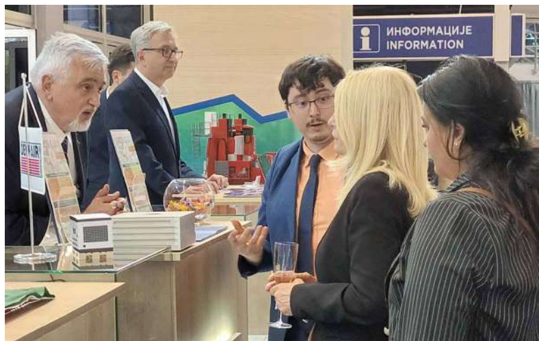
A szerb innovációs miniszter asszony a szegedi SolVElectric standjánál

Kiállítóink: Ledium Kft., Moltech AH Kft. és a Solvelectric Kft.