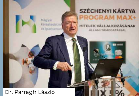
Dr. Parragh László

adják, ezért a kormány igyekszik minél több segítséget, támogatást nyújtani a vállalkozóknak azért, hogy újra tudják indítani a fejlesztéseiket. Jelezte, ennek egyik eszköze a GINOP 1.4.3-24 kódú kiírás, melyre április 30-ától nyújthatják be kérelmeiket az érintettek, 10 és 100 millió forint közötti összegekre pályázhatnak. A kiírás keretösszege 155 milliárd