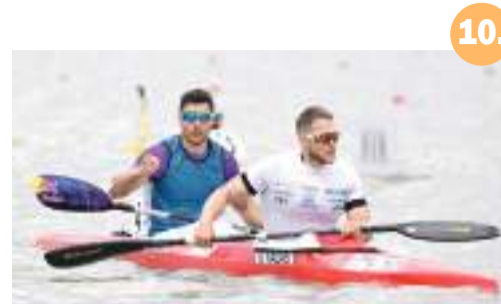
10. Újabb szegediek az olimpián!