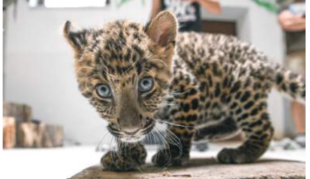
Poldi előbb a sajtó munkatársainak mutatták be. A kis párduccal egyáltalán nem foglalkozott az anyja.

Poldi a látogatók szemé láttára jött a világra. Anyja azonban egyáltalán foglalkozott vele, nem szoptatta, sőt meg sem tisztította az újszülöttet. Három óra elteltével úgy látták, a kölyök élete veszélyben van, ezért közbe kell lépni. Bár az állatkerti szakma nem támogatja a kölykök gondozók általi felnevelését, az észak-kínai leopárd annyira ritka, hogy az újszülött kiemelése mellett döntöttek. Komoly kihívást