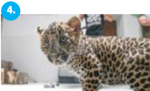
4. Cukiságbomba a vadsparkban