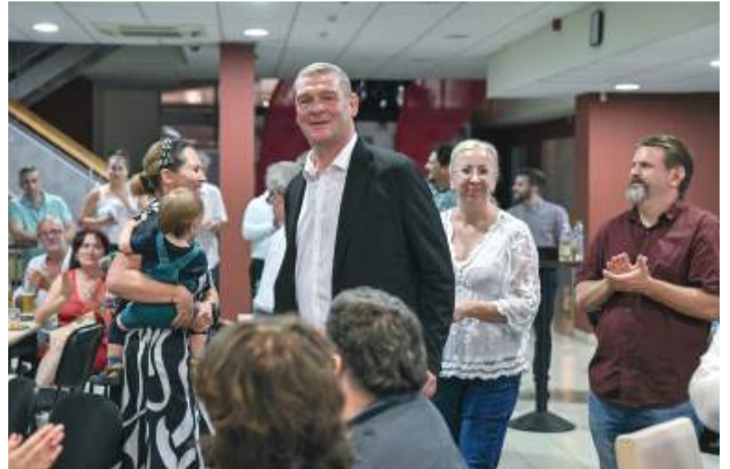
Hatalmas taps fogadta Botka László polgármestert és feleségét vasárnap éjszaka az Összefogás Szegedért Egyesület eredményváróján.

A mostani önkormányzati választáson volt a legmagasabb a részvételi arány Szegeden (55,7 százalék), és Botka László most kapta a legtöbb szavazatot (67,75 százalék), amivel hatodszorra választották meg Szeged polgármesterének. Botka László most nyert a legnagyobb arányban: több mint 30 ezer szavazattal kapott többet, mint a Fidesz-KDNP polgármesterjelöltje, Fülöp László.