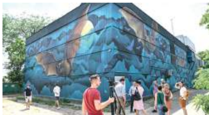
Denevérek a SZETÁV Temető utcai fűtőműének falán.

Újabb fűtőmű kapott állatokkal díszített külsőt: ezúttal a Temető utcában található SZETÁV fűtőmű újult meg a Mondolo Egyesület és a Szegedi Távfűtő Kft. együttműködésének köszönhetően. A sötétben is látványos, denevéres alkotást Vinkó Leó és Marton Ákos festették. Ez már a hatodik fűtőmű Szegeden, amelynek kopott, régi és üres falfelületei színes, ál-