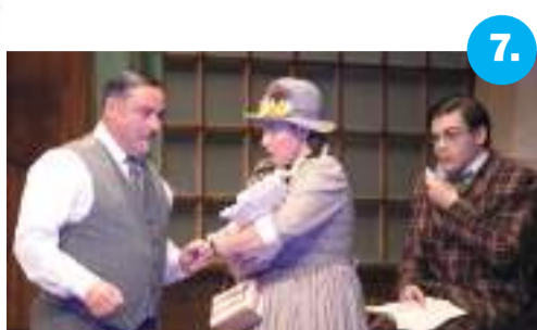
7. Sikeres évadot zárt a szegedi színház