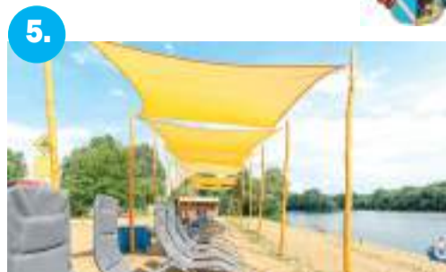
5. Pihenhetünk a megújult Sárgán