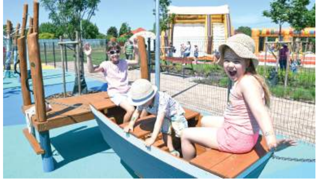
Örömmel vették birtokba a gyerekek az új játszótér Szentmihályon.

Közös öröm, hogy Szentmihályon, a Márvány utcában sikerült egy új közparkot és játszótér létrehozunk. Teljes egészében önkormányzati beruhásként valósítottuk meg – mondta az avatáson Botka László. Szeged polgármestere hangsúlyozta: előtte két lakossági fórumon kérte ki az önkormányzat a szentmihályiak véleményét arról, hogy mit szeretnének.