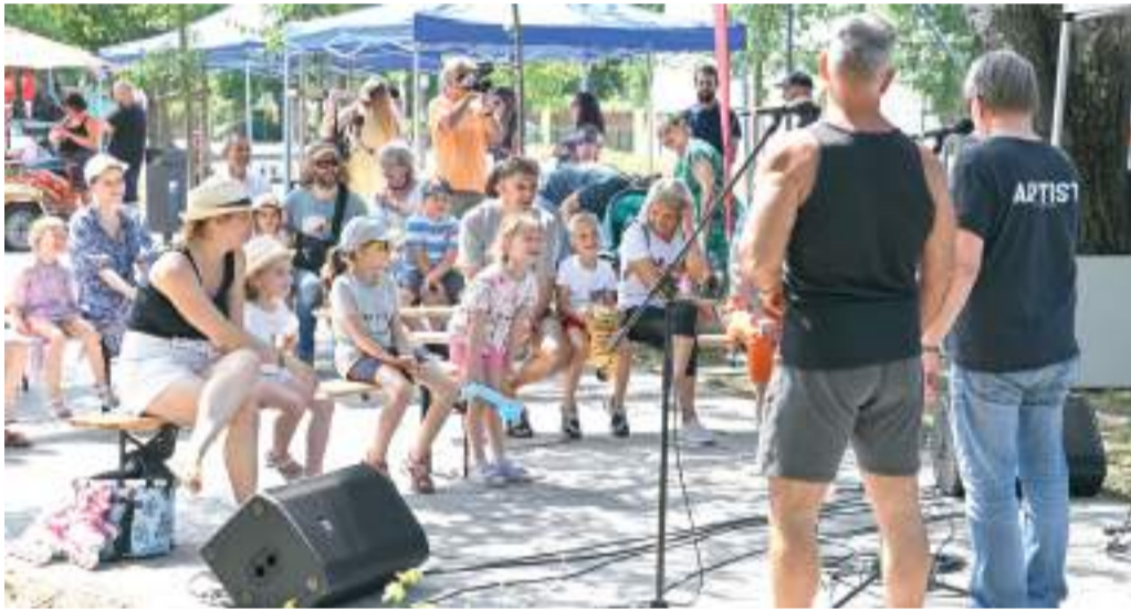
Színházi előadással, zenés programokkal ünnepelték Újszeged napját.