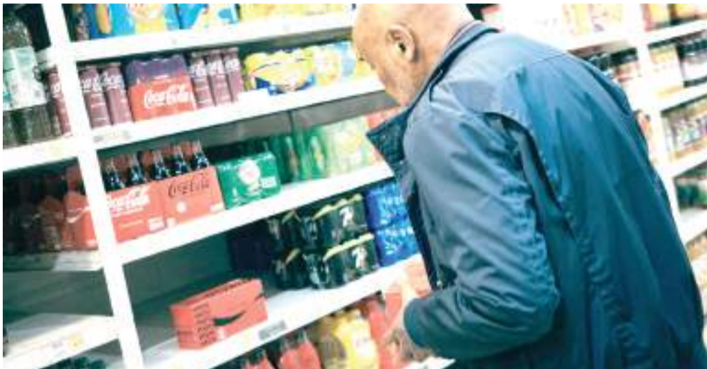
A magyar fizetések jócskán elmaradnak az európai átlagtól.

M iközben még a legalacsonyabb osztrák fizetés is a magyar minimálbér négyszerese, az élelmiszerárak tekintetében utolértük, sőt le is hagytuk Európát. Az Eurostat friss adatai alapján a Portfolio arról írt: meghaladja az uniós átlagot az élelmiszerek ára Magyarországon. Az olajok,