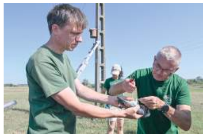
Az egyedi jelölés egyfajta rendszám, amellyel nyomon követhetik a szalakótaállomány alakulását.

Egyre több szalakóta fészkel a Dél-Alföldön. Ez a madárfaj hosszú távú vonuló, az összes hazai madárfaj közül a szalakóta telet a legmesszebb Magyarországtól. Egészen Délnyugat-Afrikáig repülnek, tehát oda-vissza közel 20 ezer kilométert tesznek meg. Száz éve a szalakóta egész Magyarországon közönséges faj volt, de a nyolcvanas évekre szinte eltűnt. Ez a madár nem épít fészket, hanem más fajok, például a harkályok által kivájt odúban vagy a természet által kialakított üregekben fészkel. A madarászok által kihelyezett odúkkal elősegítik a költésüket. A Tápé melletti réten álló egyik villanyoszlopra került odú, amibe be is költöztek a madarak, és összesen négy fióka kelt ki. Nemrég gyűrűzték meg őket a szakemberek. Az egyedi jelölés egyfajta rendszám, amellyel nyomon követhetik az állomány alakulását. Meg tudják nézni, merre jár, hány kilométert tett meg egy madár. A gyűrűket megfelelő eszközzel, távcsővel, fényképezőgéppel vagy egy jobb videokamerával is le lehet olvasni.