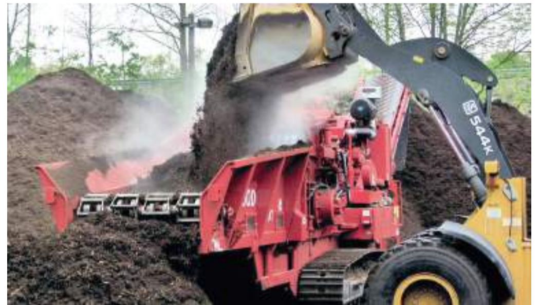
Komposztardaló. Képünk illusztráció.

A Szegedi Környezetgazdálkodási Nkft. gyűjti be a kerti hulladékot, majd értékesíti az akár műtrágyát is helyettesíteni képes komposztot. Az önkormányzati cég első fecskéként még húsz évvel ezelőtt nyert uniós pályázaton forrást a komposztáló megépítésére. Az ilyen komplexum még ma is egyedinek számít az országban.