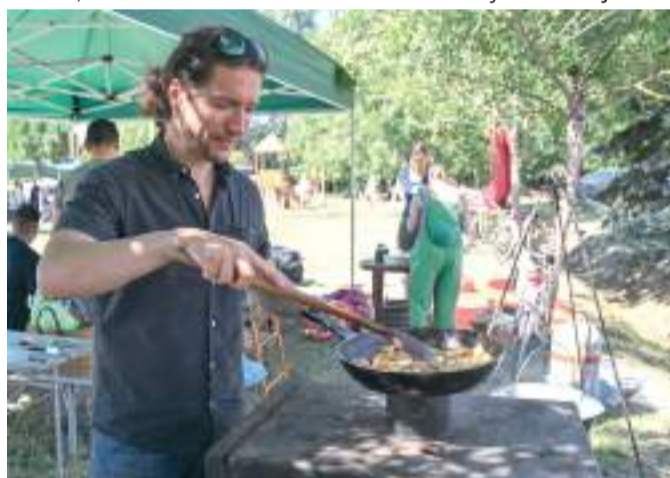
Pirul a szalonna.