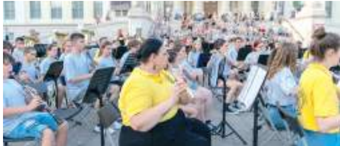
A Dél-Alföldi Regionális Fúvószenekar koncertje a Móra-parkban.

Barbuquejo Néptánc Együttes (Spanyolország)