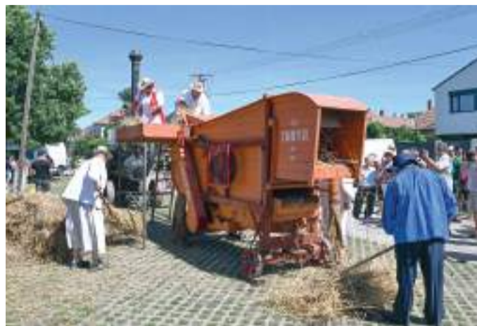
Működés közben mutatták be a százéves, gőzmeghajtású cséplőgépet.

A tarhonyafesztivál csúcshelyezése a főzőverseny, ami idén rekordot döntött a résztvevők száma miatt: huszonkét csapat nevezett be a viadalra. A rendezvényen bemutattak egy 1926-ban gyártott, gőzzel meghajtott cséplőgépet – működés közben.