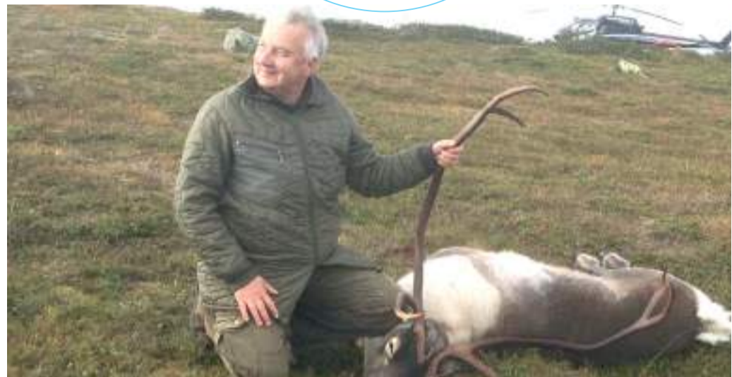
Luxusvadászat. Semjén Zsolt miniszterelnök-helyettes pár éve egy óránként 750 ezer forintért bérelhető helikopterrel eredt a rénszarvasok nyomába Svédországban.

Attól nem kell félni, hogy a kormány felszámolja az Egy a Természettel Nonprofit Kft.-t, hiszen a vadászat Semjén Zsolt és Kovács Zoltán szívügye. Helyette minden bizonnyal idén is megtolják őket közpénzzel.