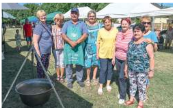
Főzőcsapat a fesztiválon.

A tizenkilencedik alkalommal megrendezett tarhonyafesztivál főzőversenyén volt klasszikusnak számító kolbászos, szalonnás változat, de készült csirkehúsból és marhalábszáróból is tarhonyás étel. Egy fiatal csapat profi füstölőszerkezetet is alkalmazott, amitől valóban pikánsan füstös íze lett a tarhonyás ételnek.