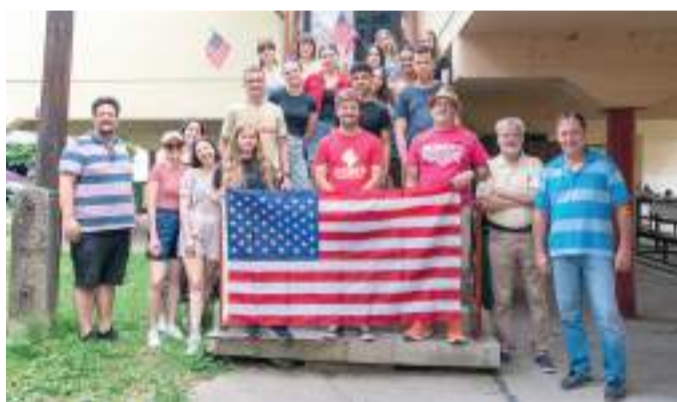
Az amerikai vendégek a házigazda szegediekkel a Partfűdőn.

Az egyhetes nyelvi tábor Szeged és Toledo három évtizedes testvérvárosi kapcsolatának köszönhetően jött létre. Az idei már a hetedik volt. A magyar diákok anyanyelvi tanároktól tanulhatták az angol nyelvet.