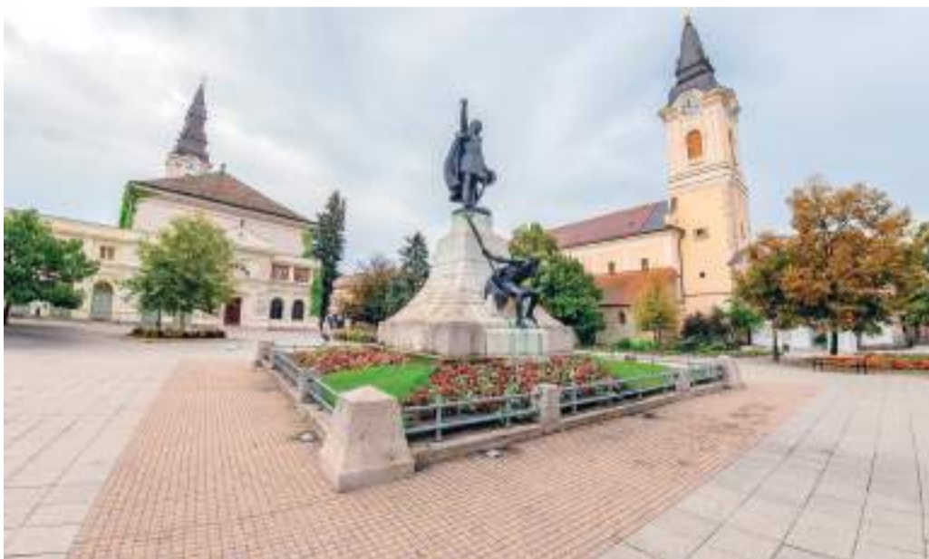
Mintha elnéptelenedett volna Kecskemét. Kecskemét belvárosa.

2010 óta 105 ezres népességsökkenést okozott a kivándorlás