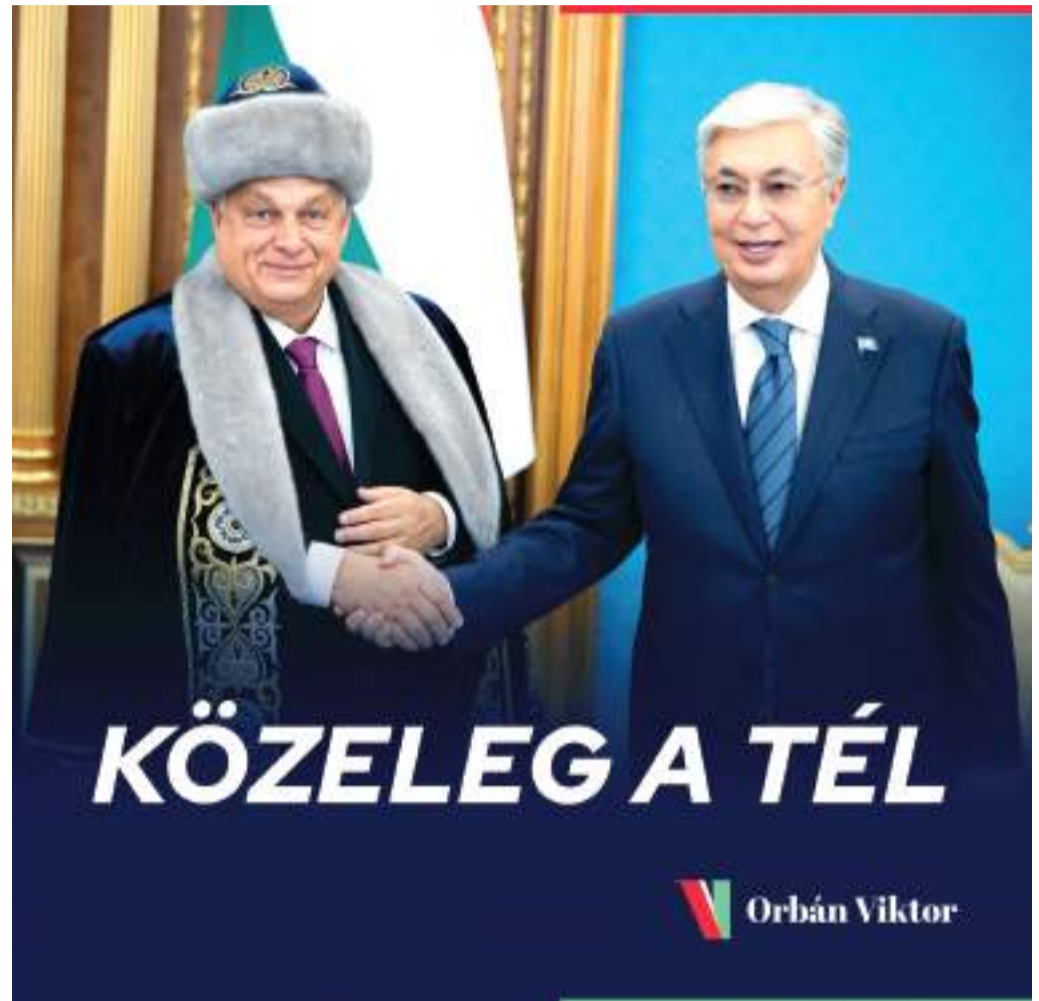
Orbán Viktor kazah öltözékben a kazah elnökkel.

A két hisztis nőszemély tehát nem engedett, nem kötöttek vérszerződést, nem karolták fel Don Vityát, aki bosszúból sajátos háborút hirdetett. Felfogadott egy balga külügyért, Sancho Pitört, megutaztatta luxuszachton, Lavor-érdemrendet járt ki neki, sőt szuper diplomiszterre nevezte ki. Ígéretével rávette, hogy főfegyvernői minőségben kísérelje el útjain, mivel számtalan kínos