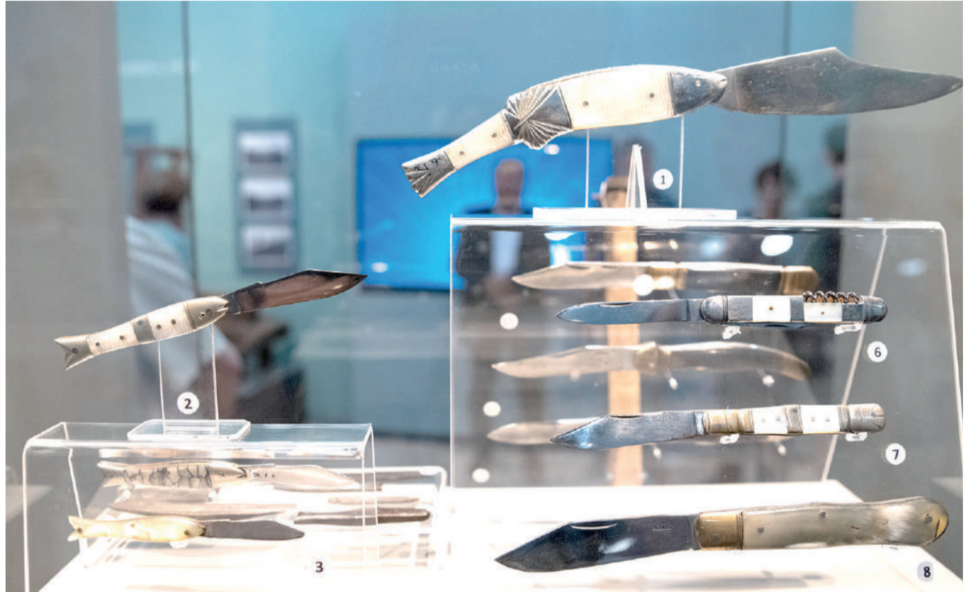
A késesség jeles helyet foglal el a szegedi mesterségek között a termékeinek formájával, tartosságával. Nemzetközi hírnevét a Sziráky-féle halas bicskának köszönheti.