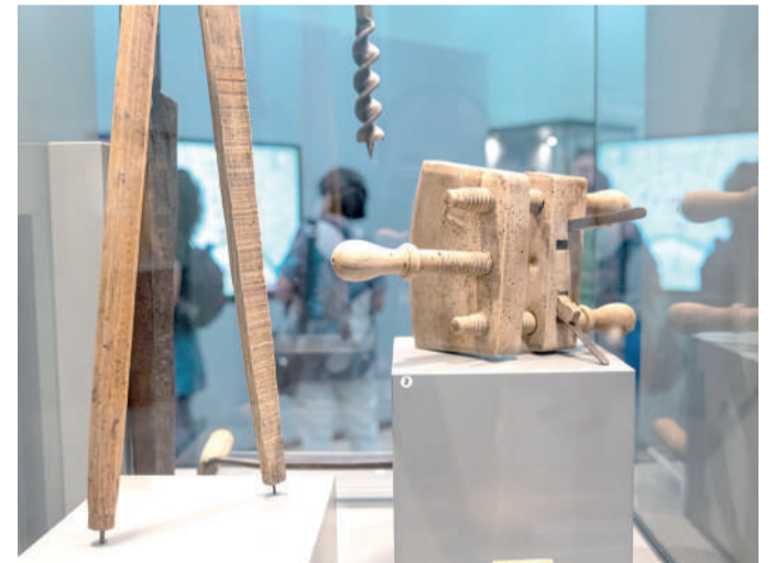
Szeged lakóinak legfőbb megélhetési forrása évszázadokon át a föld megművelése és az állattartás volt. A várost ölelő homokpuszták feltörése a 19. század végén, a 20. század elején fejeződött be.