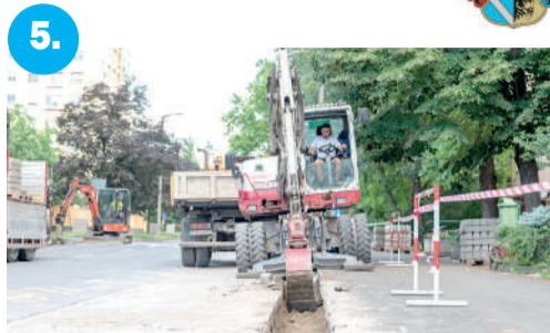
5. Elkezdődött a Vedres utca felújítása