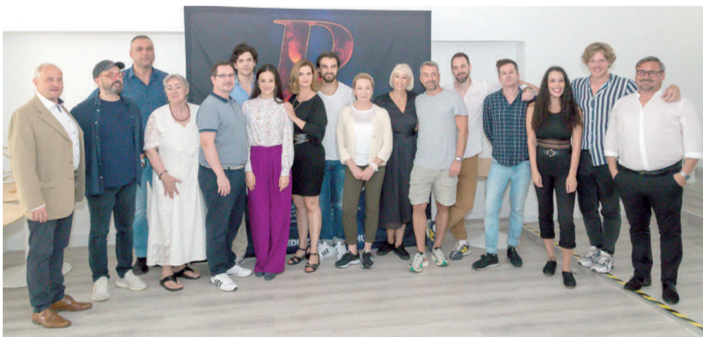
Elkezdődtek Pesten a Rebecca olvasópróbái. A stáb összeállt.

mindösszesen 10 százalékos jegyáremeléssel növelték a saját bevételeiket, amire nagy szükség mutatkozik, hiszen a fenntartó önkormányzat támogatása mellé idén a szabadtéri nem kap állami dotációt. A költségek ezzel szemben viszont folyamatosan inflálódnak, emelkednek. A főigazgató beszámolt arról is: a szabadtérről a napokban elérték a kerekén egymilliárd forintos saját bevételt. Bevezették a budapestihez hasonló dinamikus árazást,