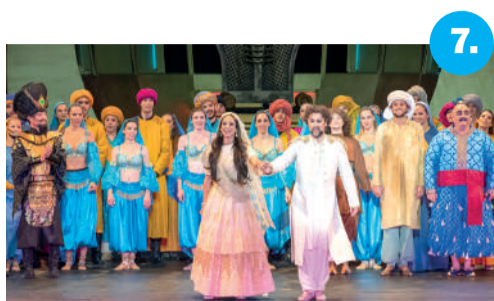
7. Rekordnézőszámmal indult a szabadtéri