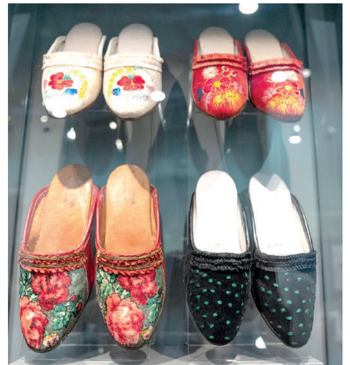
A hímzett fejű papucs készítésének módja és divatja a török hódoltság korából származik, a 16–17. században honosodott meg országszerte, de országos hírnevet csak a szegedi mesterek által készített lábbelik szereztek.

Bárkányi Ildikó, a kiállítás főkurátora, a múzeum néprajzkutatója elmondta, azoknak a néprajzkutatóknak is emléket állítottak, akik Szeged népéletéről, néprajzáról maradandót alkottak, és akiknek a tudására építve hozták létre a tárlatot. Így Kálmány Lajost emelték ki, aki papként szinte az egész szegedi nagytájon teljesített szolgálatot. Minden állomáshelyén néprajzi gyűjtést végzett, és kötetek sorozatát jelentette meg a gyűjtött anyagból. Krónikásként említik Tömörkény Istvánt, aki nem kutató, hanem a Somogyi-könyvtár és a múzeum igazgatójaként az ő nevéhez fűződik a néprajzi gyűjteménynek a megalapítása. Számos kötetben írt a szegedi paraszti életéről, elkészítette az első tájszótárt. Bálint Sándor néprajzkutató használta először a szegedi nemzet szókapcsolatot, munkásságának és életének minden perce Szeged kutatásához kapcsolódott. Megalkotta a szegedi nemzet monográfiáját és a szegedi szótárt. Tanítványa, Juhász Antal vette át a néprajzi gyűjteményt, a szegedi nagytáj kutatásában is jeleskedett.