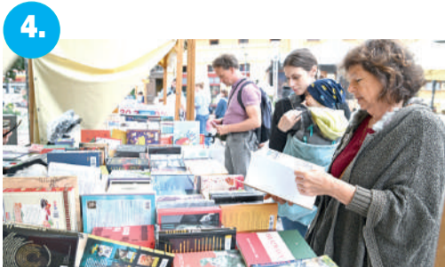
4. Mit jelent a szegedieknek a könyv?