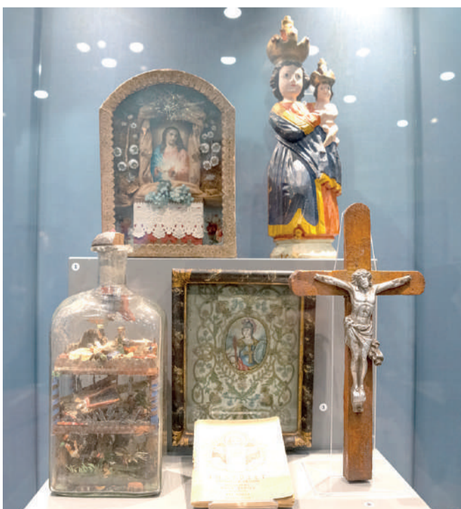
A szegediek két legfontosabb búcsújáróhelye Alsóváros és Máriaradna volt. Ezekhez hozzátartoztak a vásárok is, ahonnan a búcsúsok vásárfiával tértek haza.