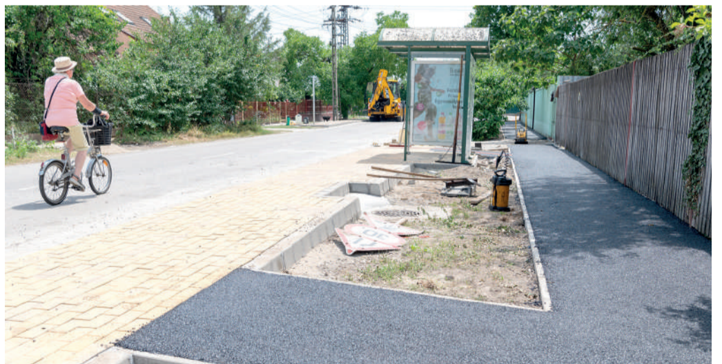
A peronokat 56 négyzetméteren kiselemes térkő burkolattal látták el, taktilis sávokat készítettek, akadálymentesítve a megállókat.

Befejeződött az Alkotmány utca Ladvánszky és Gyümölcs utca közötti szakaszán a két forgalmas buszmegállóhely és a hozzákapcsolódó járda felújítása – tájékoztattott Szénási Róbert, a körzet önkormányza-