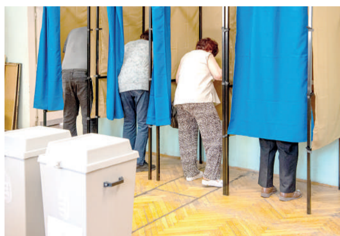
Részvételi rekord született. A választásra jogosultak 55,7 százaléka szavazott Szegeden.

A fideszesek a 111 szavazókörből csak nyolcban tudtak nyerni. Ebből hat szavazókörben a választókerületben van,