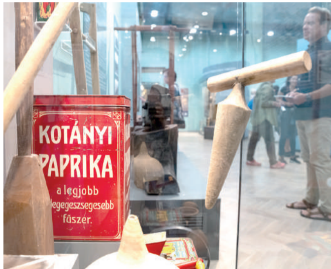
A korábban jelentős dohánytermesztés háttérbe szorult, helyét a paprikatermesztés vette át. 1899-re a termőterülete már 3800 holdra emelkedett Szeged körül.