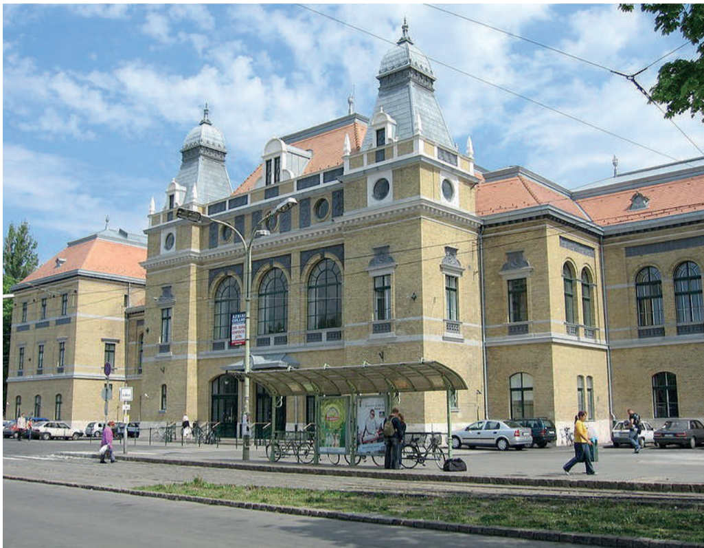
Várakozás közben a szegedi nagyállomáson is versekkel múlathatják az időt az utasok.

Nyár végéig magyar költők verseitől hangosak idén is a MÁV-Volán-csoport állomásai. A Vers a peronon kezdeményezés részeként magyar költők művei csendülnek fel: 69 állomáson összesen 38 vers hangzik el. Így Szegeden a nagyállomáson és a Mars téri buszpályaudvaron hallhatók a költemények.