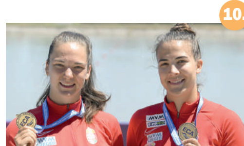
10. Magyar éremeső a Maty-éren