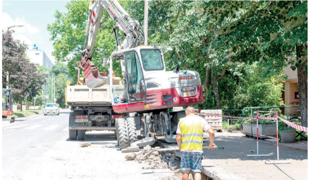
Megindult a Vedres utca felújítása.

A Fő fasonon, a Csanádi és a Vedres utcában zajlanak burkolatfelújítási munkák.