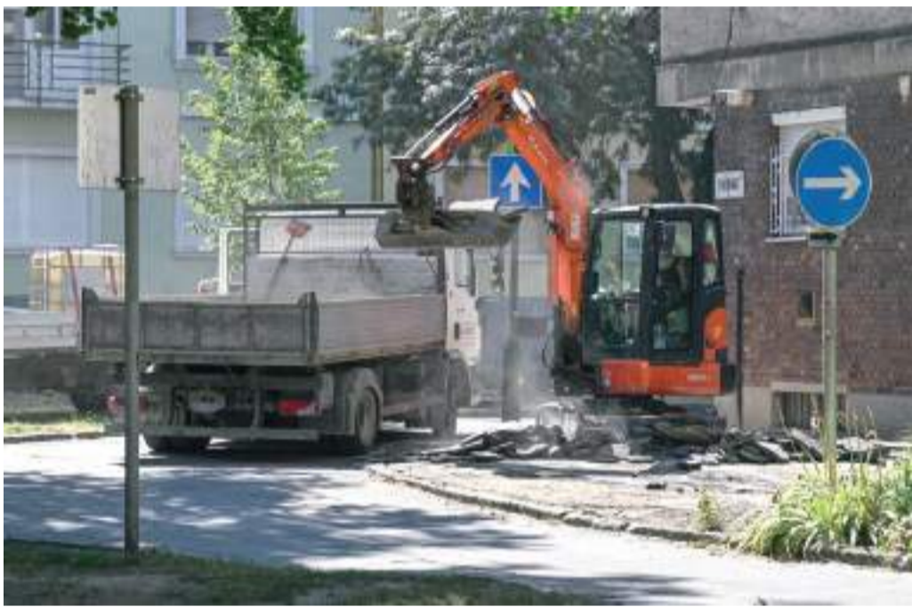
Megújulnak a Palánk tömbbelső járdái és útjai.

Ezzel egy időben szakszerűen felújítják a Somogyi utca Oskola utca és Korányi fasor közötti járda- és útszakaszát, valamint a Palánk tömbbelsőben lévő Béla, Révai, Palánk és Tömörkény utca járdáit és útburkolatát. Itt várhatóan november végére végeznek a munkával.