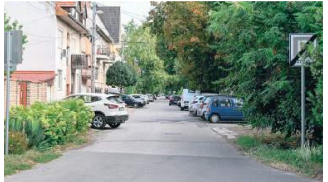
A Hóbiárt basa utcát is egyirányúsítják a Római körüttől a Debreceni utca irányába.