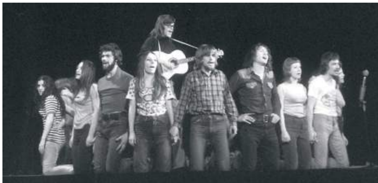
Jelenet az egyetemi színjátszók 1972-es Petőfi Rock című előadásából.