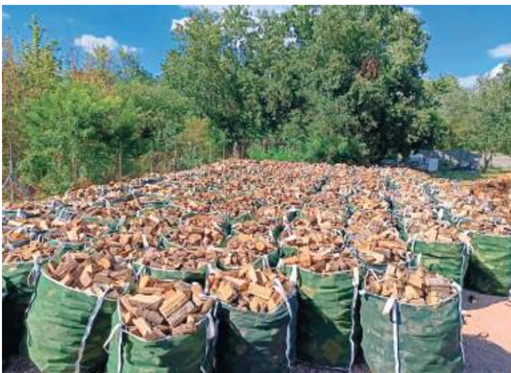
Kiszállásra vár a becsomagolt tűzifa.

– Idén összesen 824 szegedi család részesül tűzifátámogatásban. Mindenki közel egy erdei köbméter fát kap majd, amelynek kiszállítása szeptember 2-án indul, és a tervek szerint novemberre mindenki megkapja a tűzifát. Erre az önkormányzat idén több mint 76 millió forintot fordít – mondta Ménesi Imre, aki hozzátette: idén a tavalyihoz képest mintegy száz szegedi családdal több kap ingyen tűzifát a várostól.