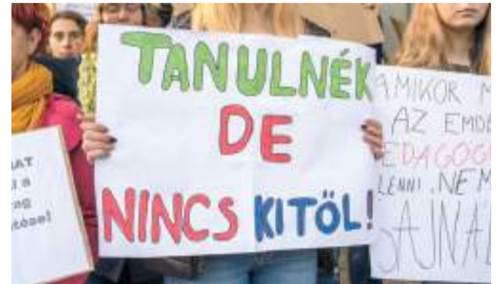
Diákok transzparensa a tanársztrájkok idején.

Nem véletlen, hogy a parlament még júniusban, gyorsított eljárásban fogadta el azt a törvényt, amely lehetővé teszi, hogy 55 év feletti katonatisztek is jelentkezessenek tanárnak,