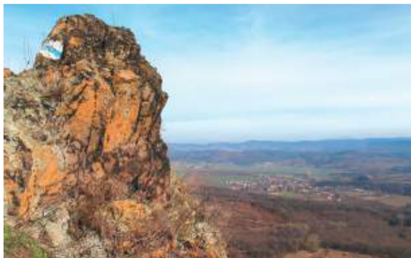
A könyvborítón a szandai várhegy látható, a Cserhát kéktúra útvonaláról.

négy-öt nap alatt a Bükkben meg a Mátrában száz kilométert. Közben szakmáztunk, jól éreztük magunkat, és én, mint doktoranduszhallgató, a földtani ismeretekről meséltem. Egyetem után Békéscsabára kerültem, akkor következett az elméleti rész; az összes hegységnek sorra végigírtam a szakmai háttérét. Ezek a cikkek megjelentek 2017 és 2022