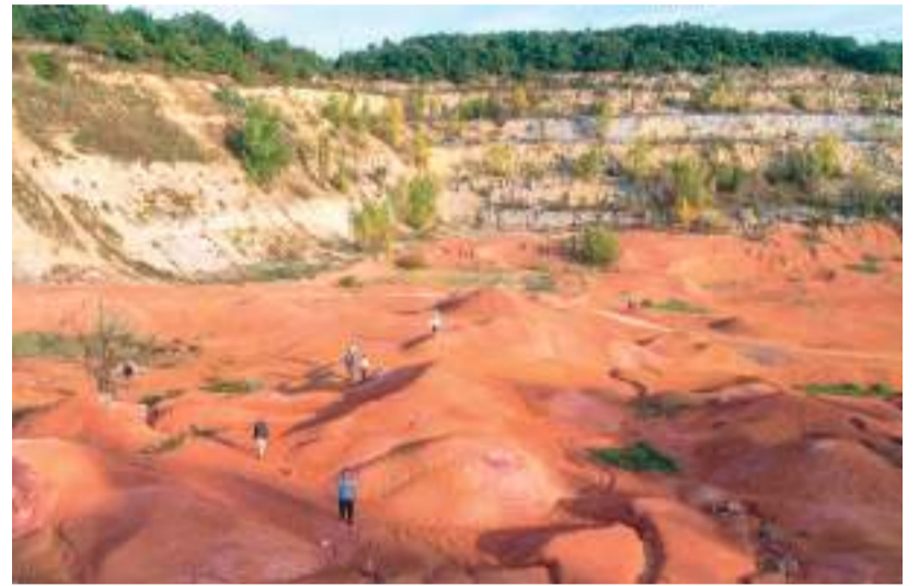
Marsbeli táj a Bagoly-hegy felhagyott külszíni bányájának területén, Gánt mellett. A hivatalos kéktúra útvonala nem érinti, de érdemes megnézni.

– Szegeden és környékén az alföldi lapályon vagyunk. Azok a kőzetek, amik nem messze, Nagylakon túl, a romániai Zarándi-havasokban, az Erdélyi-szigethegységben megtalálhatók, azok itt is megvannak, alattunk több ezer méter mélyen. Magyarul ilyen klasszikus értelemben vett földtani látnivalókat nem találunk, de azért van egy-két érdekesesség az Alföldön is. Itt a kőzeteket, amiket én is bemutatok terepen, elég egyedi módon találjuk meg, például a várba beépítve, hiszen építőanyagként sokat felhasználtak ezek közül. A tiszaszigeti mélypont is kuriózum, de a Szeged környékén feltárt réti mészkő is az. Másrészt, de ugyancsak látványosságok a kiskunsági homokbuckák vagy