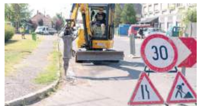
Szeged városa saját forrásból fedezi az útfelújítás 80 millió költségét.