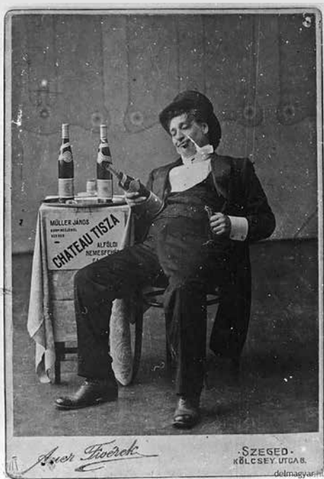
Chateau Tisza borreklám