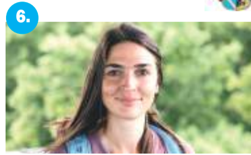
6. 2550 kilométer gyalog 72 nap alatt