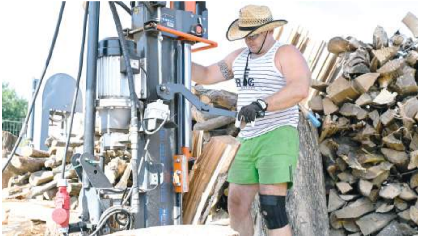
A Szegedi Környezetgazdálkodási Nkft. telepén dolgozzák fel a városi cég által kivágott fákat, lenyesett gallyakat. Ebből készül a szociálisan rászorulóknak számára téli tüzelő.

824 szociálisan rászoruló szegedi kap idén az önkormányzattól téli tüzelőt, minden eddiginél többet. Saját forrásból a város 71 millió forintot költ erre. Az igénylőknek a következő hetekben viszik házhoz a tűzifát a környezetgazdálkodás telepéről.