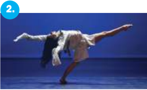
2. Országos színházi évadnyitó Szegeden