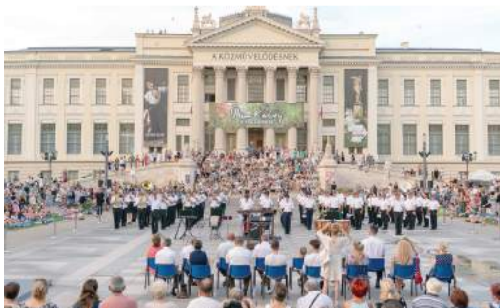
A Móra-park egyik legnépszerűbb rendezvénye a Katonazenekari Fesztivál volt.

A nyár első két hónapjában a Nemzeti Turisztikai Adatszolgáltató Központ (NTAK) adatai szerint 2,9 millió külföldi és hazai utazó 7,9 millió vendégéjszakát töltött a fővároson kívül. Budapest és a Balaton mellett a nyár slágerének számít több vidéki úti cél is. A legnagyobb vendégforgalmi növekedést mutató desztinációk a belföldi vendégek körében Szeged és térsége 6 százalékos növekedéssel a tavalyihoz képest. 127 ezer vendégéjszakát töltöttek itt a hazai vendégek. A külföldi látogatók esetében pedig Debrecen és térsége volt a legnépszerűbb. A legnagyobb forgalombővülést a települések közül Velence és Balatonkenese érte el.