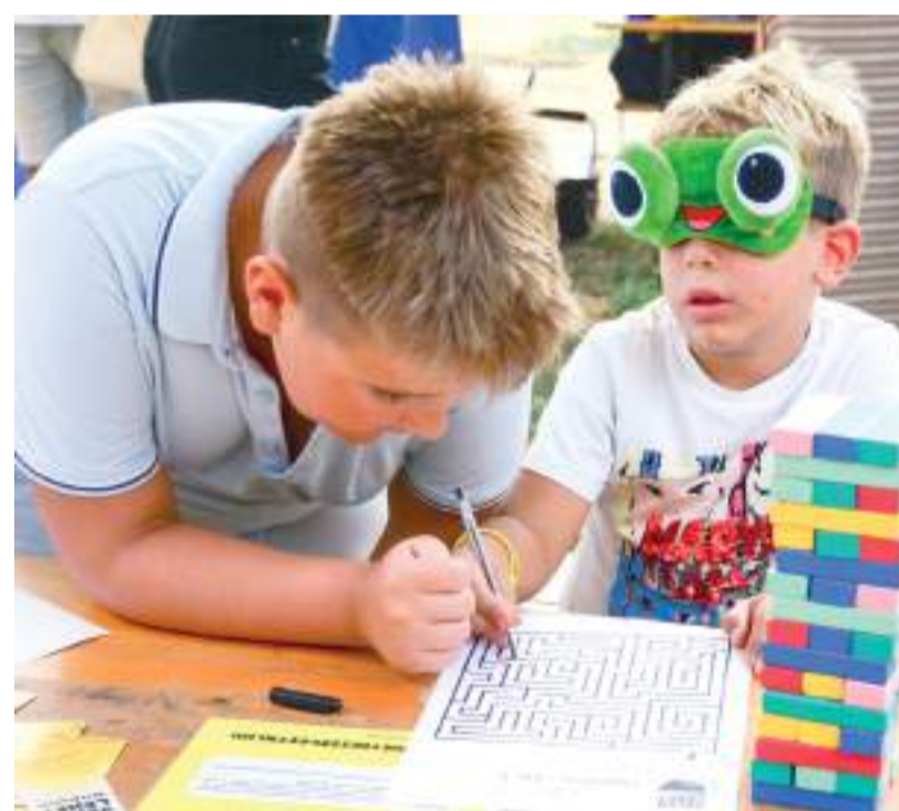
A Civil faluban 33 szervezet biztosított időtöltést.