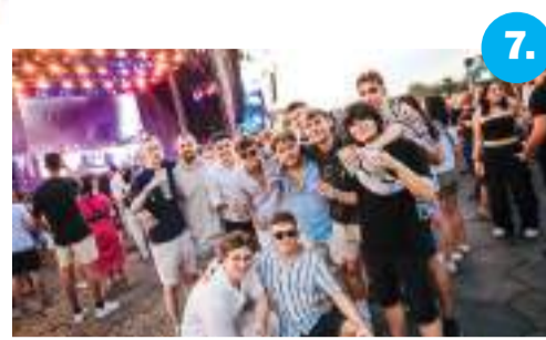
7. A SZIN zárta idén is a nyári fesztiválokat