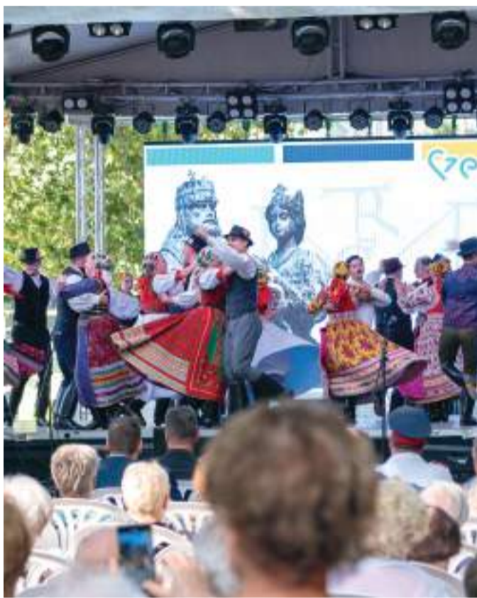
Az augusztus 20-i hosszú hétvége is telt házas volt.

A legnagyobb növekedést a vendégforgalomban a bel-földi vendégek körében Szeged és térsége érte el 6 százalékos növekedéssel a tavalyihoz képest. 127 ezer vendégéjszakát töltöttek itt a hazai vendégek. Ez derült ki a nyár első két hónapjában a Nemzeti Turisztikai Adatszolgáltató Központ számai alapján. Az augusztusi adatok ugyan még nem állnak rendelkezésre, de annyi már látható, hogy szinte telt házzal pörgött idén nyáron a turizmus Szegeden. A Tourinform vezetője úgy látja, a legvonzóbb nyári rendezvény továbbra is a szabadtéri játékok, emellett meghatározó Szeged komplex kínálata a vendéglátásban. Részletek a 3. oldalon