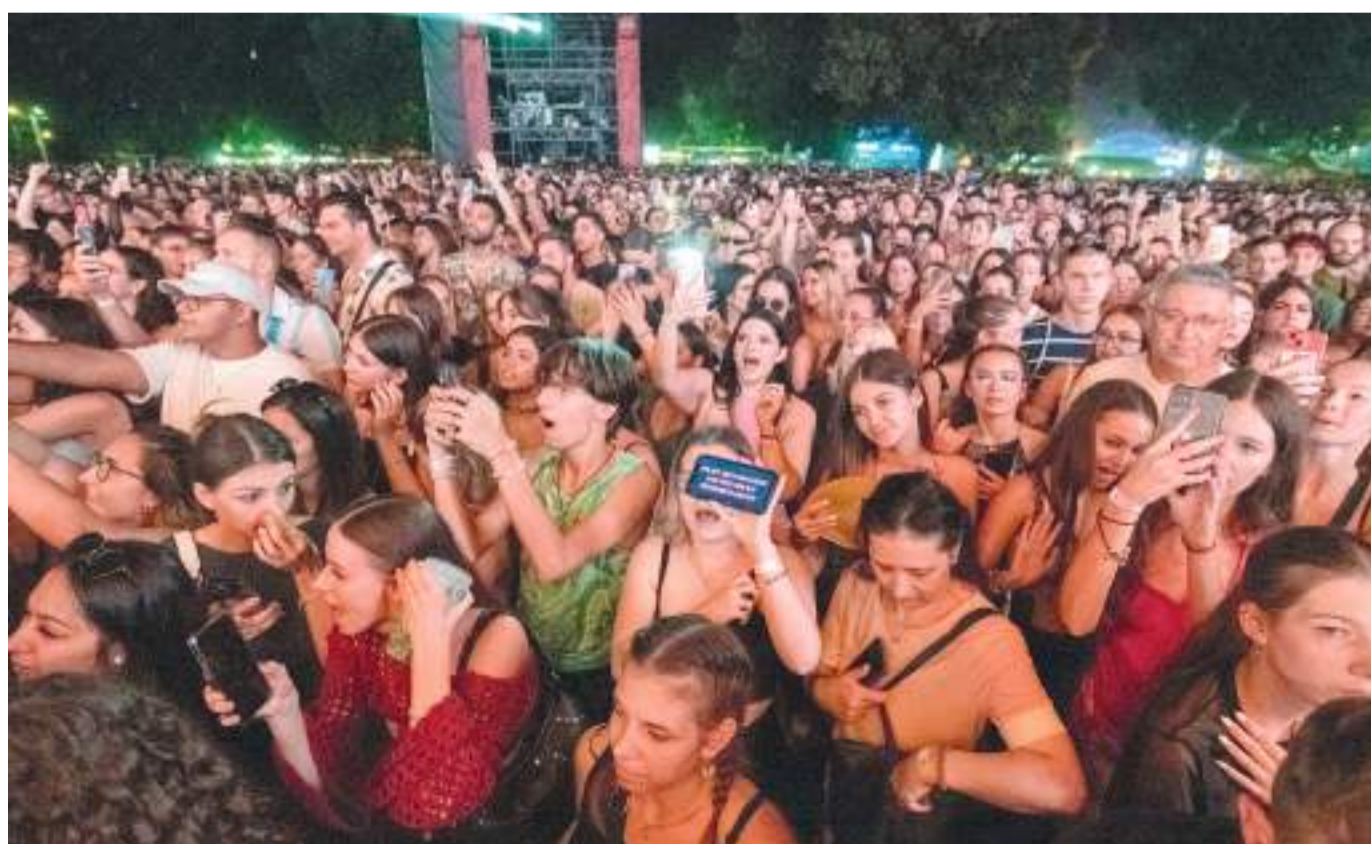
Titkos üzenet a kedvenc énekesnek.