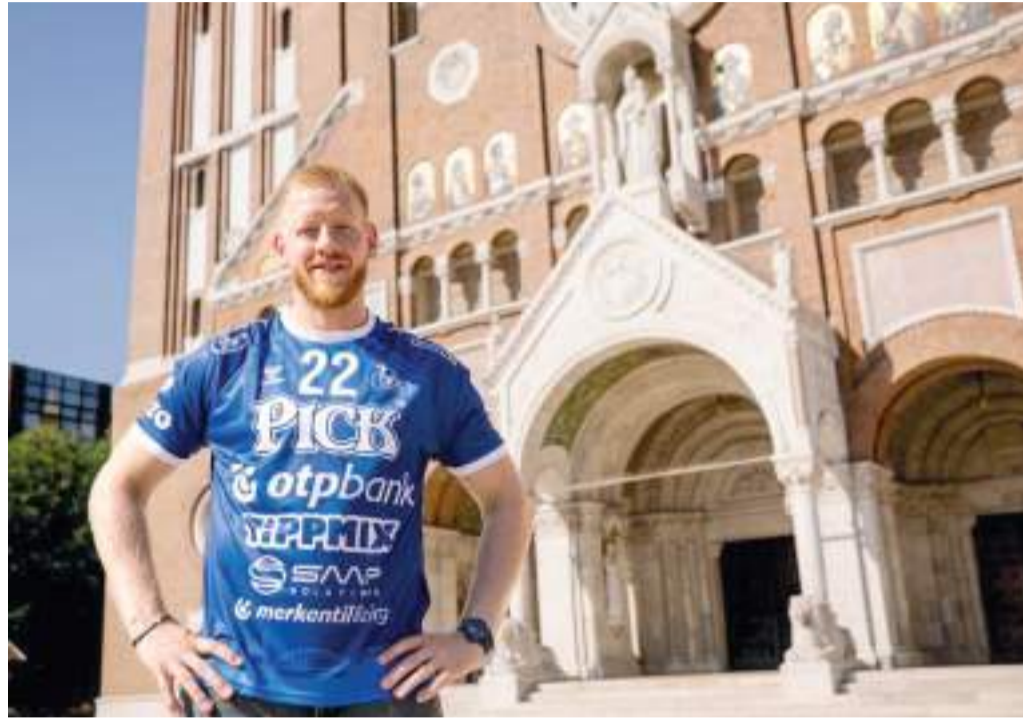
Már a Dóm térrel is megismerkedett Jim Gottfridsson.

A beosztás, férfiak, A csoport, Eger: BVSC, Kaposvár, Eger, DVSE, B csoport, Szeged: Honvéd, Szeged, Miskolc, Pécs, C csoport, Szentes: OSC, Szolnok, Szentes, UVSE, nők, A csoport, III. kerületi TVE: Szentes, III. kerületi TVE, Tatabánya, B csoport, Szeged: KSI, Szeged, BVSC.