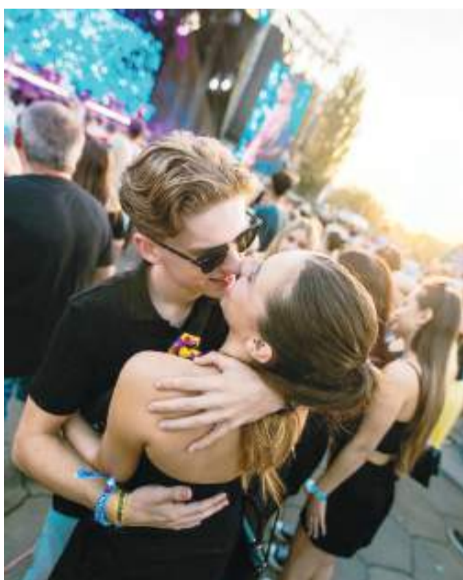
SZIN, tánc, szerelem.