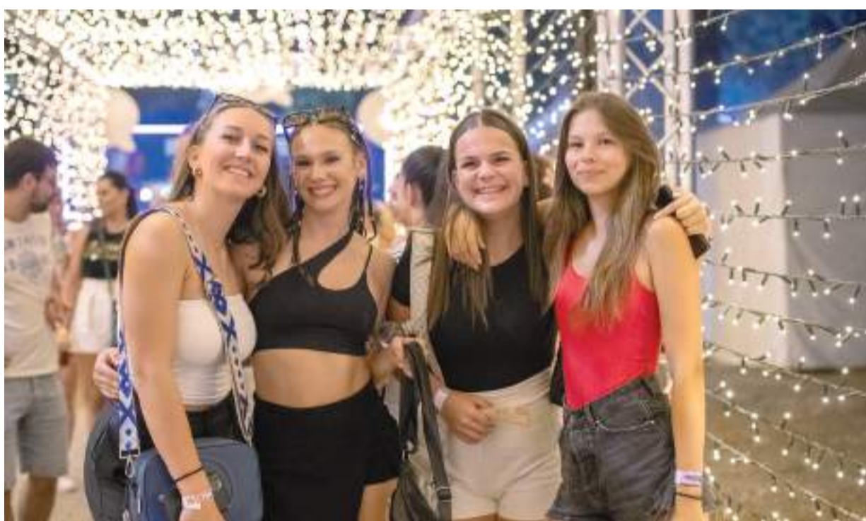
Aki látszani akart, fényben fürdőzött.