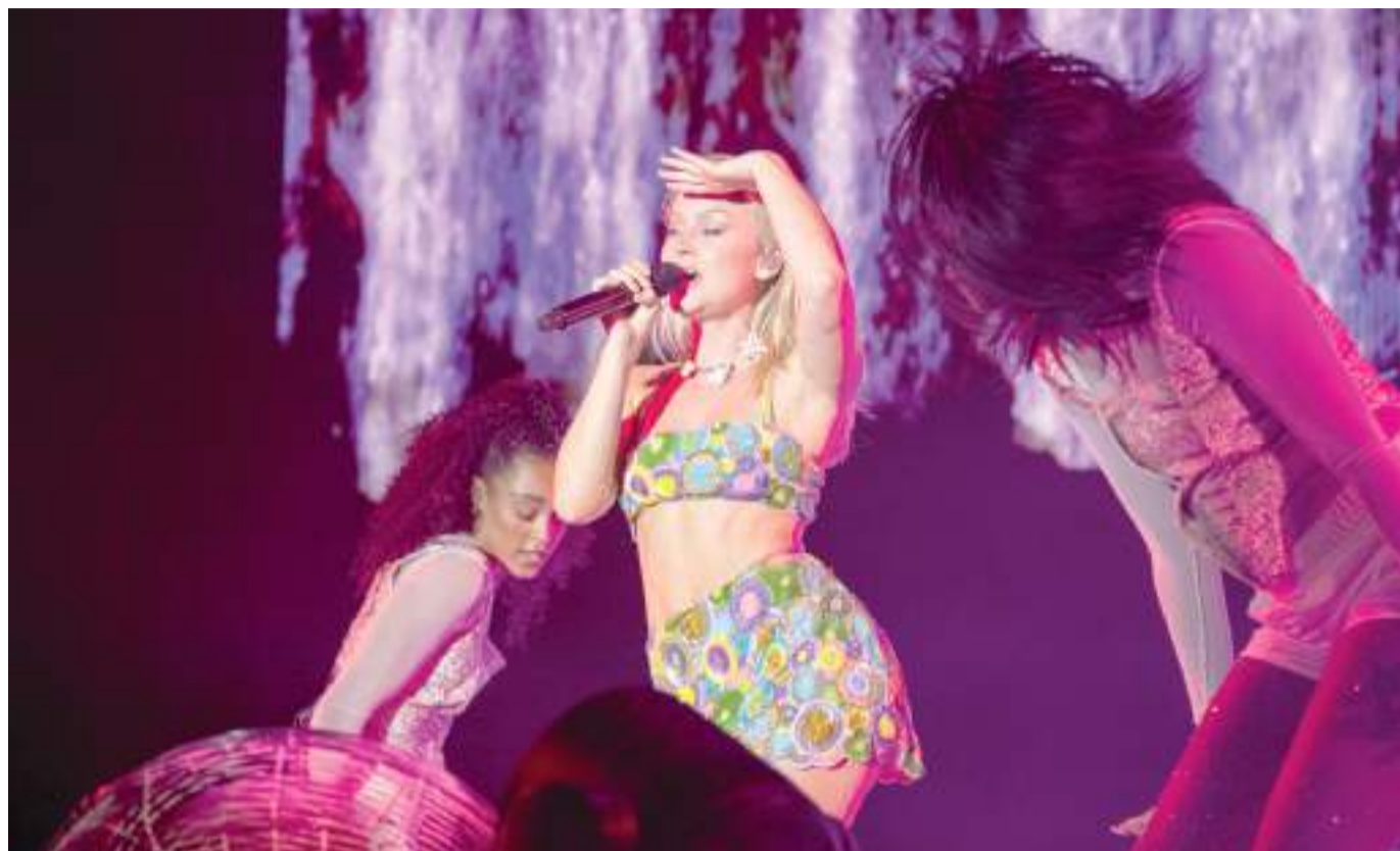
A legnagyobb külföldi sztár, Zara Larsson a nyitónapon lépett színpadra, óriási sikerrel.

S zegeden idén ismét a Szegedi Ifjúsági Napok zárta a nyarat, úgy is mondhatjuk, a SZIN volt az ország legnagyobb nyárázó fesztiválja. Több mint százezren látogattak ki a rendezvény négy napjára, ahol tíz helyszínen 200 programot kínált a SZIN. A két nagyszínpad előtti tereket sorra megtöltötték a nemzetközi sztárok és a közkedvelt hazai zenekarok koncertjei. A 115 vendéglátósnál is sorok kígyóztak, a Civil faluban 33 szervezettel ismerkedhettek a fiatalok és régebb óta fiatalok. Mert az idei, 56. SZIN is megmutatta, ez a fesztivál több generációt meg tud szólítani. A szeged.hu-t idén egy első SZIN-ező tudósította a helyszínekről, Domokos Krisztián. Élménynaplójába a harmadik napon azt írta a közönségről: „Újfént meglepett, hogy nagyon sokan Budapestről jöttek le, mert, idézem: »a SZIN a legjobb fesztivál«. Na nem mint ha nem élvezném, de ez engem is meglepett, mert beavatatlanként eddig az volt a fejemben a kánon, hogy a Sziget az aranyérmes magyar fesztiválélmény. De nem. »Szigeten is voltunk, de a SZIN magasan felülmúlja a Szigetet.« Nem reprezentatív kutatásomban a SZIN nyert, méghozzá azzal, hogy a SZIN-en »sokkal könnyebben megmutatkozik az emberek kedvessége.« „Annyira jó, annyira családias, biztonságos, élményt ad” – foglalta össze egy lány.