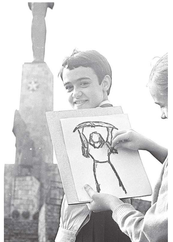
A Szabadság-szobor talapzatáról készült 1968-as fotón még ott látható a szovjet katona, amit 1956-ban ledöntöttek, majd visszaállították, és 1992-ben a Memento Parkba vittek.