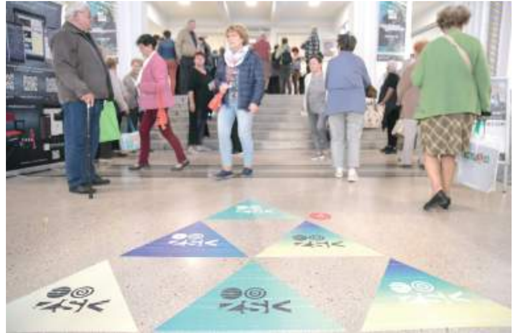
Gyülekezik a közönség a Belvárosi moziban, egy korábbi filmfesztivál egyik vetítésére.

A fesztivált a Szilágyi Zsófia által rendezett, Janu-