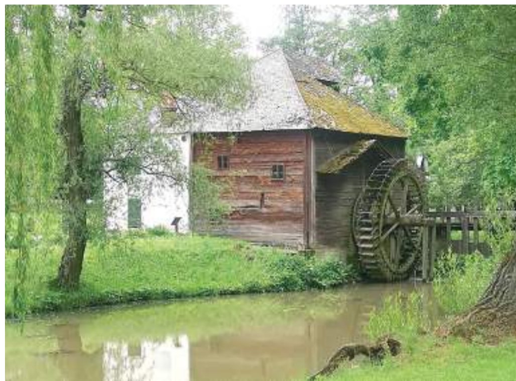
A Göcseji Falumúzeum vízimalma.

A fotókból Malomtúra címmel ismeretterjesztő film is készült, mely az egyesület Facebook-oldalán (Nap-Fény Nyugdíjas Fotókör) látható.