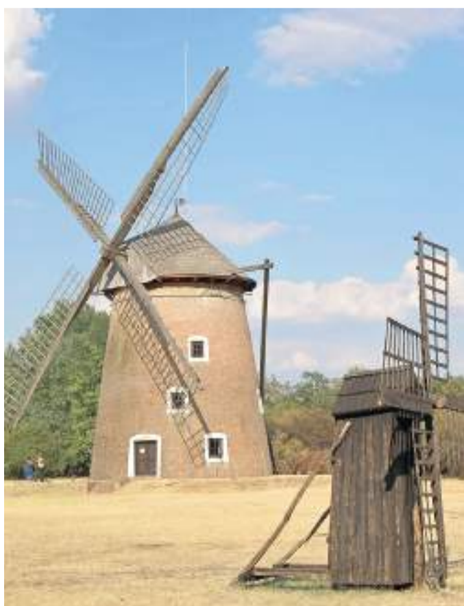
Az ópusztaszeri szélmalom és hordozható malom.