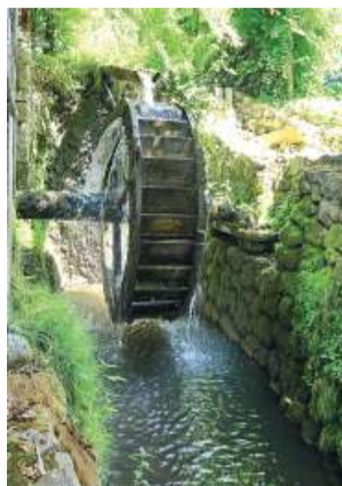
A torockói vízimalom kereke.