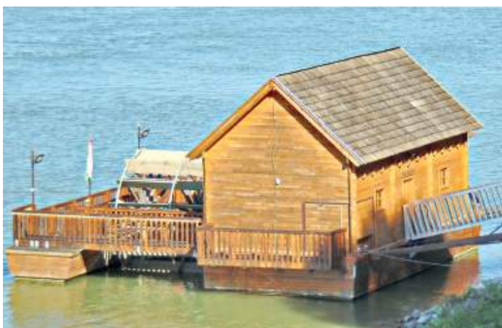
A bajai hajómalom.