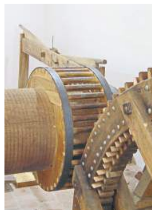
Az orfűi papírmalom, részlet.