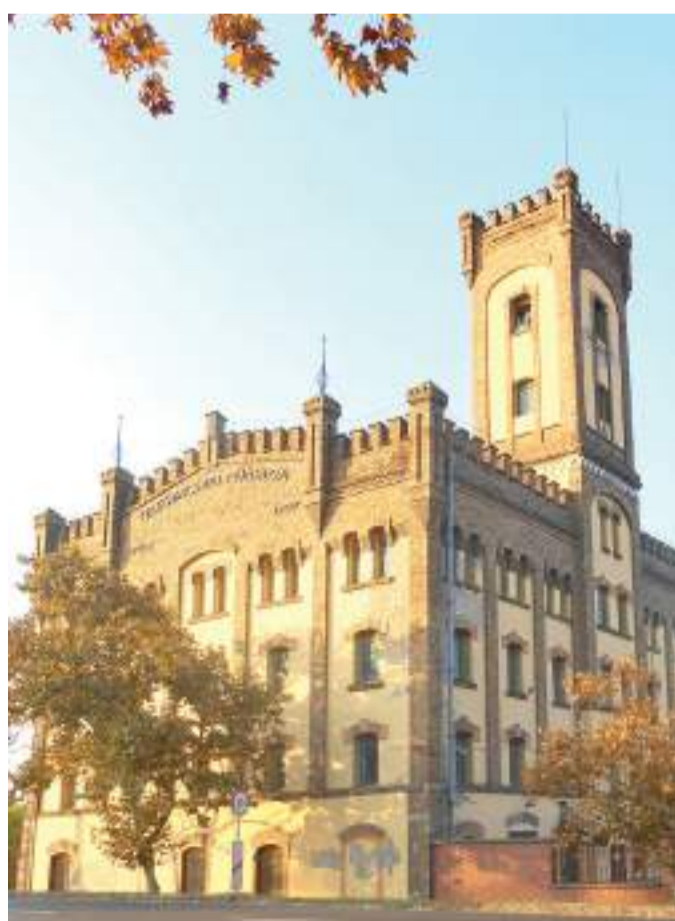
A felsőbácskai malmom.