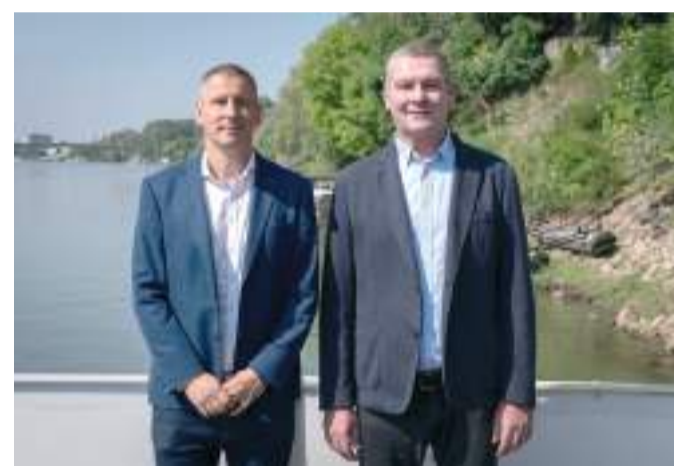
Botka László és Nemény András, Szombathely polgármestere Szegeden.

Botka László és Nemény András, Szombathely újaválasztott polgármestere Szegeden egyeztettek az önkormányzatok helyzetéről, jövőbeni lehetőségeiről és a Fidesz-kormány forráselvonása által okozott kihívásokról. Egyetértettek abban, hogy egy város akkor élhető, ha összetartó, szolidáris a közössége. Botka László polgármester szerint a jövőben kiemelt jelentősége lesz a hasonlóan gondolkodó polgármesterek együttműködésének. Cikkünk a 3. oldalon