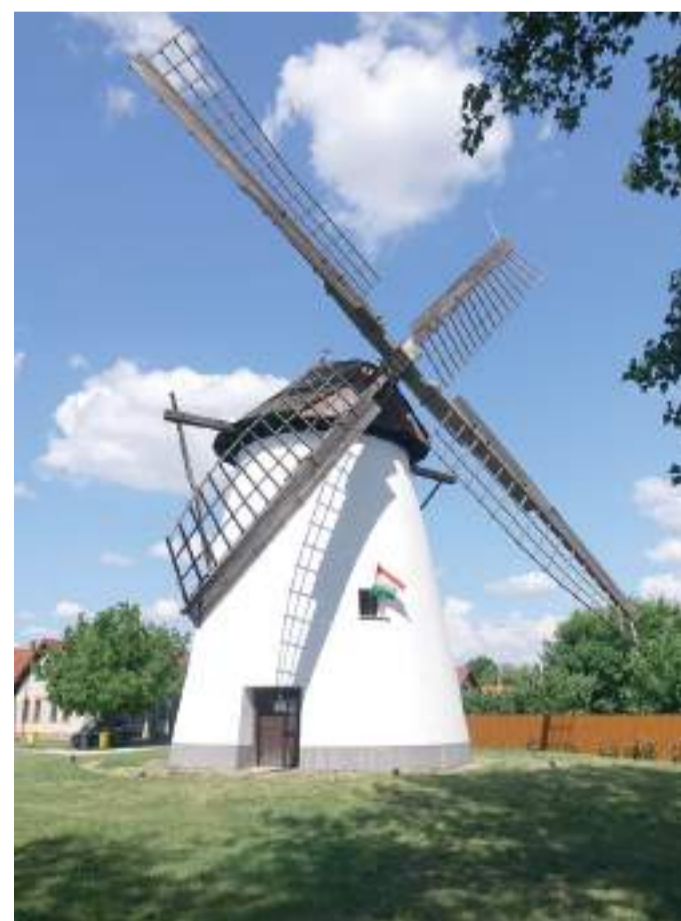
A dorozsmai szélmalom.