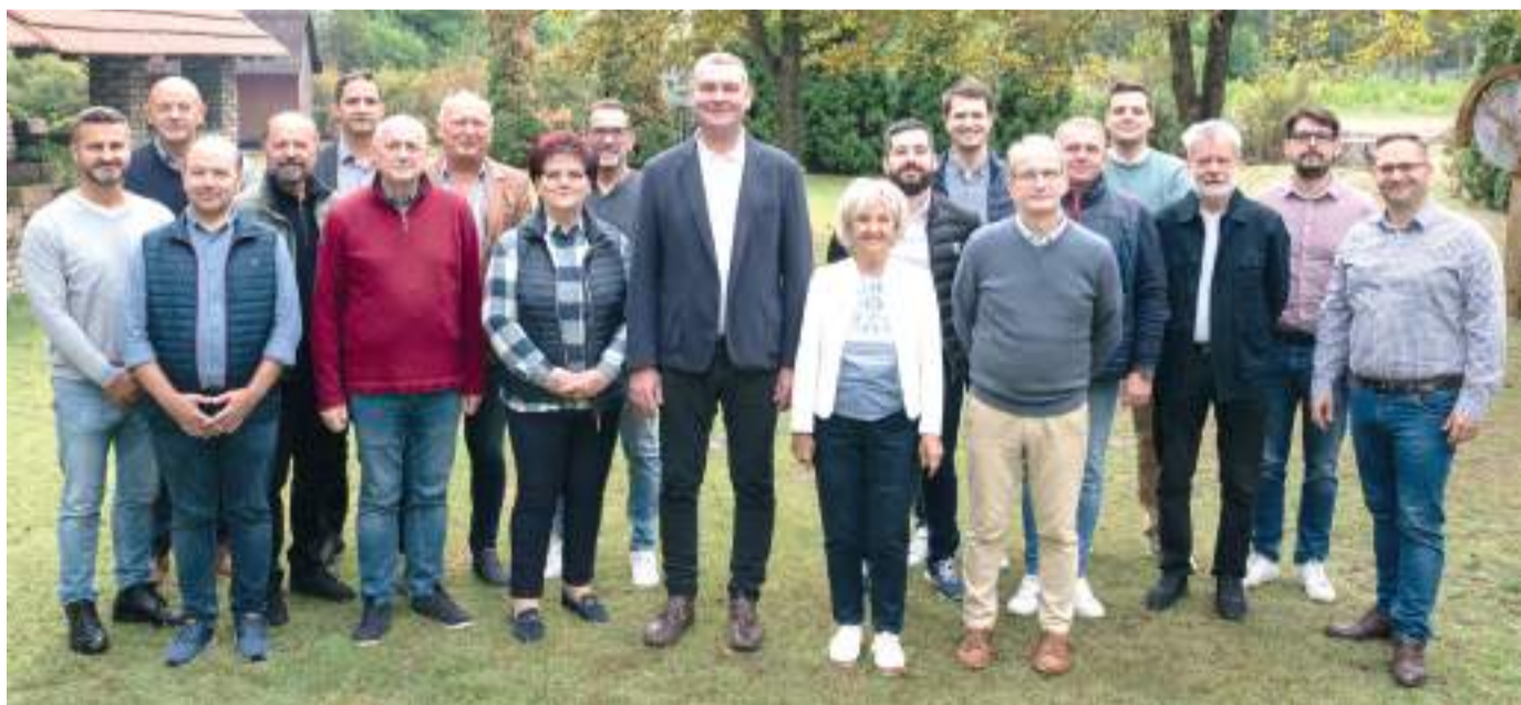
Első ülését tartotta az Összefogás Szegedért frakciósövetség.

A júniusi önkormányzati választások után szűk négy hónappal, október 4-én alakul meg az új közgyűlés Szegeden.