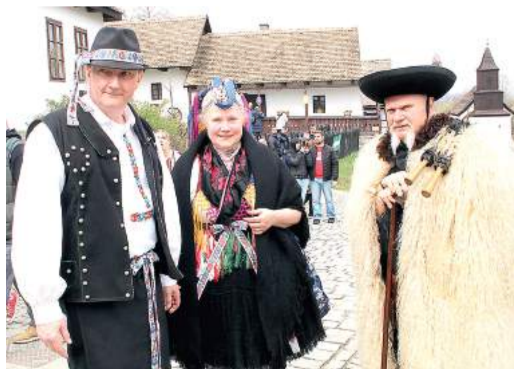
Hollókői ünnepi palóc viselet.