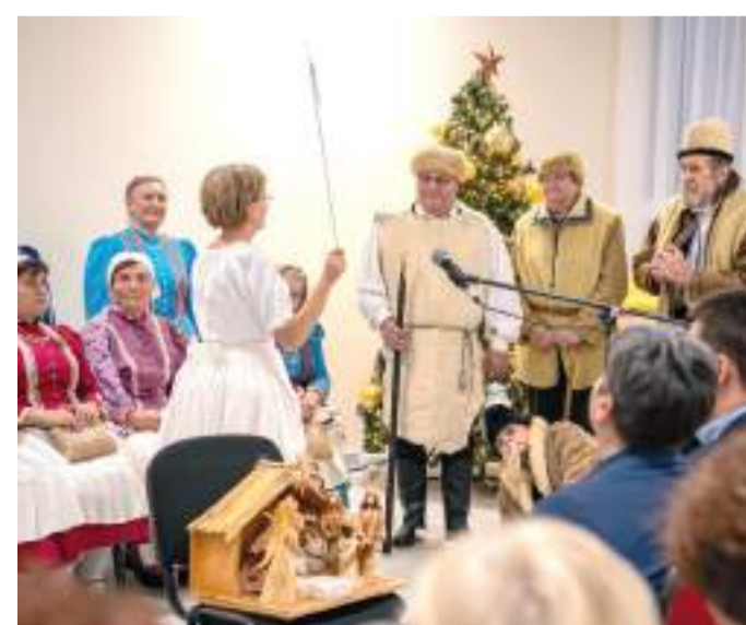
A Tápai Hagyományörzők betlehemes játékot adtak elő a Senior Centerben.