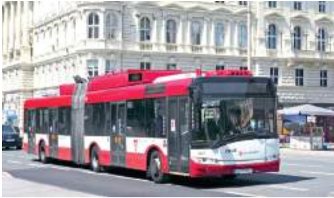
Solaris Trollino Salzburgban.

Szeged városa 50 millió forint támogatással, törzstőkeemelés formájában segíti a Szegedi Közlekedési Társaságot alacsony padlós, használt trolibuszok beszerzésében. A régi Škoda trolibuszokat Salzburgból érkező Solaris Trollinók váltják fel. Az első jármű már megérkezett Szegedre.