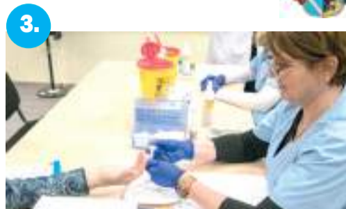
3. Szívügyünk az egészség!