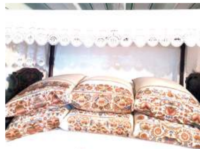
Vetett ágy a hódmezővásárhelyi tájházban.

A Nap-Fény Nyugdíjas Fotóköri Egyesület tagjai az elmúlt években fotótúráikon az adott táj népművészeti, kézműves emlékeivel is ismerkedtek. Évzáró kiállításukon a Somogyi-könyvtár dorozsmai fiókkönyvtárában ebből adnak ízelítőt január 2-ig. A kiállításához kapcsolódó filmben az egyesület Facebook-oldalán (Nap-Fény Nyugdíjas Fotóköri) azokhoz is elviszik a kiállítás képanyagát, akik a kiállítást nem tudják a helyszínen, Kiskundorozsmán, a Negyvennyolcas utca 12. alatt a könyvtár nyitvatartási idejében megtekinteni.