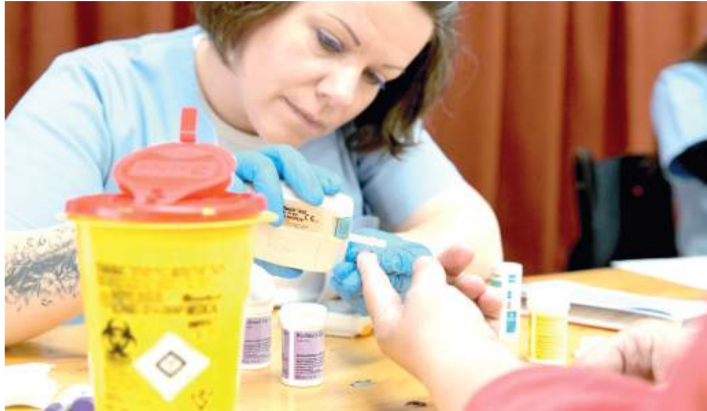
Szegeden az ujjbegyes vizsgálat alapján 405 regisztráltból 243-nak javasolták a részletesebb laborparamétereket kimutató vénás vérvételt a szakemberek.

Szeged önkormányzata a jövőben is tervez ingyenes egészségügyi szűrővizsgálatokat