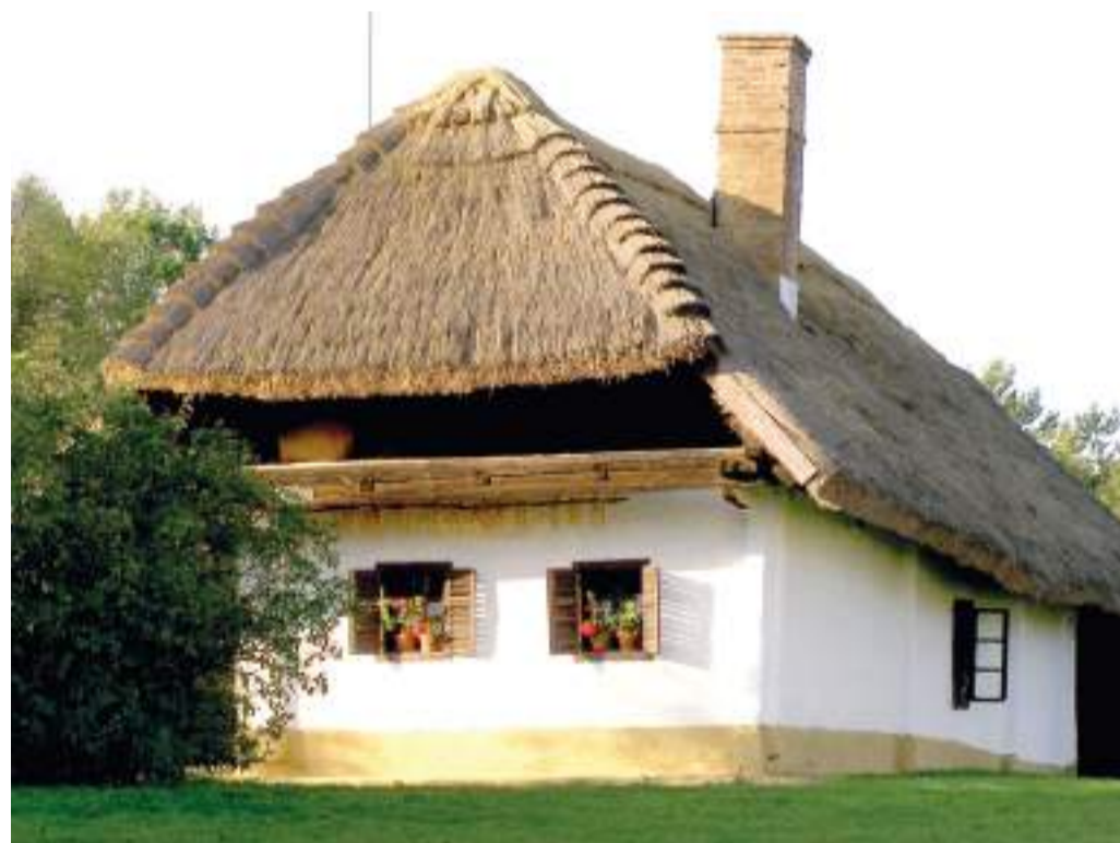
Zsúpfedeles kerített ház Pityerszeren.