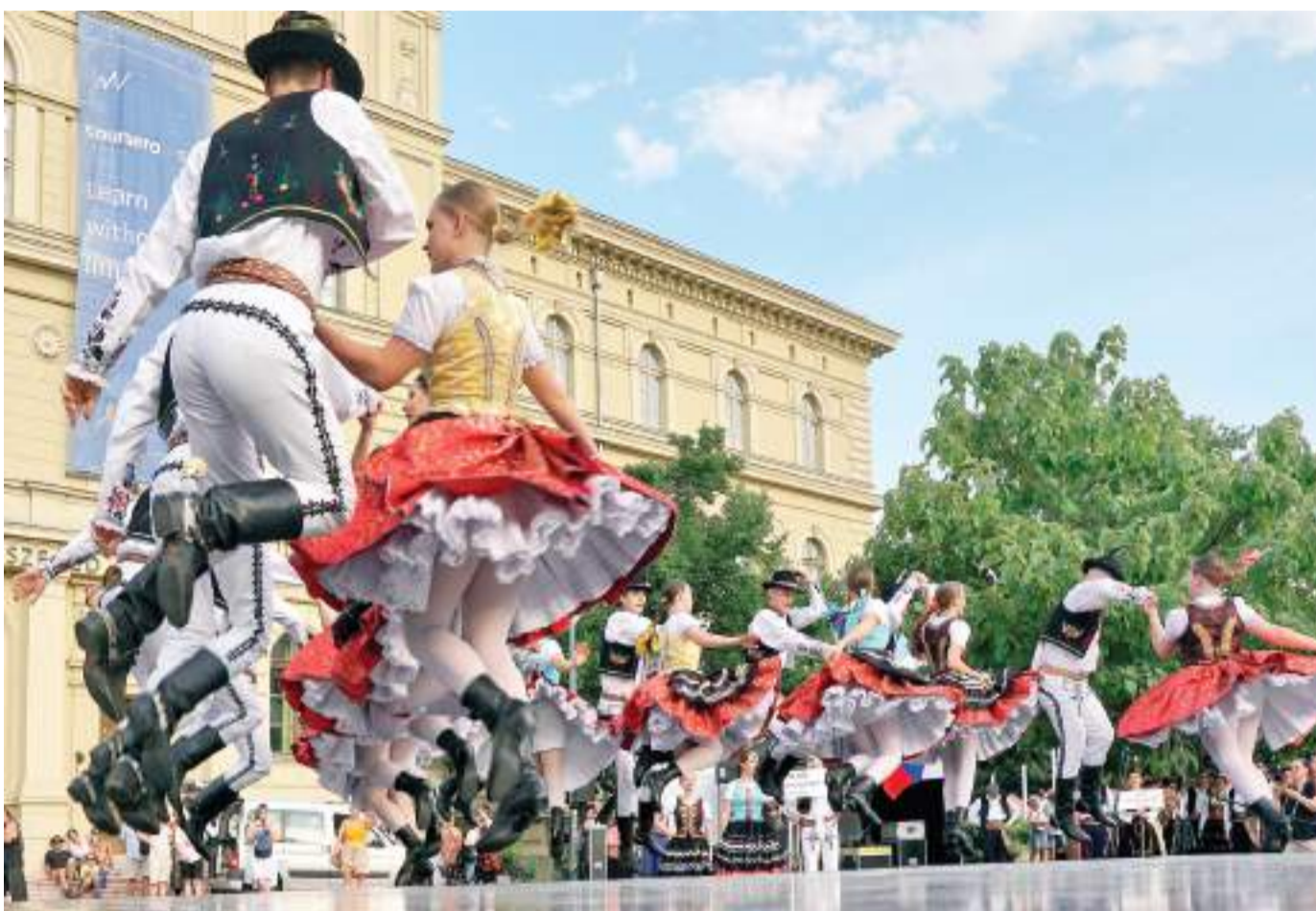
Szegedi néptáncfalózkodó 1.

A Nap-Fény Nyugdíjas Fotóköri Egyesület tagjai az elmúlt években fotótúráikon az adott táj népművészeti, kézműves emlékeivel is ismerkedtek. Évzáró kiállításukon a Somogyi-könyvtár dorozsmai fiókkönyvtárában ebből adnak ízelítőt január 2-ig. A kiállításához kapcsolódó filmben az egyesület Facebook-oldalán (Nap-Fény Nyugdíjas Fotóköri) azokhoz is elviszik a kiállítás képanyagát, akik a kiállítást nem tudják a helyszínen, Kiskundorozsmán, a Negyvennyolcas utca 12. alatt a könyvtár nyitvatartási idejében megtekinteni.