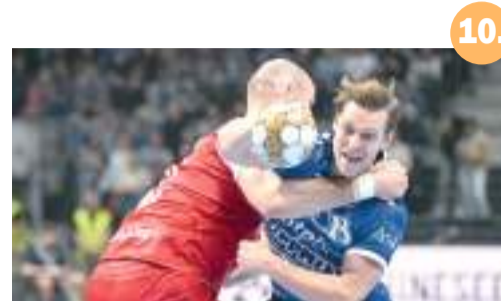
10. Jól áll a Pick Szeged a BL-ben