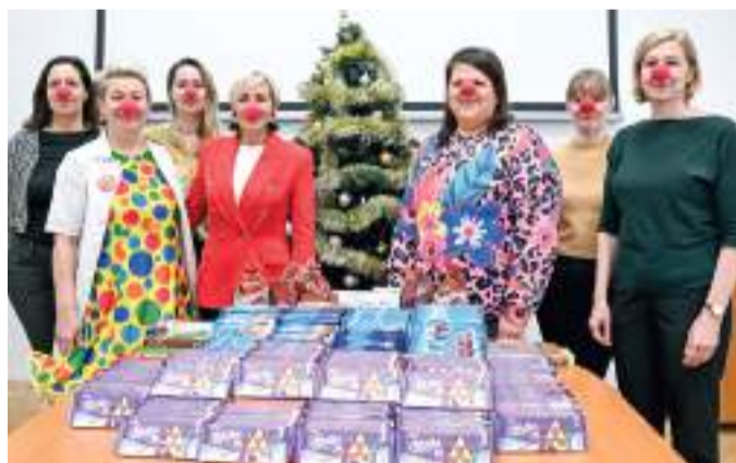
A hivatal dolgozói egy-egy tábla csokoládéval járultak hozzá a Karitáció Alapítvány bohócdoctorainak gyógyító munkájához.

Idén 12. alkalommal szervezték meg a Karitáció bohócdoctorai azt az összefogást, amellyel az ünnepek idején kórházban fekvő gyermekek számára juttatnak el csokoládét. A kezdeményezés célja a gyermekek gyógyulása, hiszen a bohócdoctorok jelenléte, a vidámság gyógyító ereje, és nem utolsósorban a csokoládé köztudottan szorongás-csökkentő hatása elősegíti a