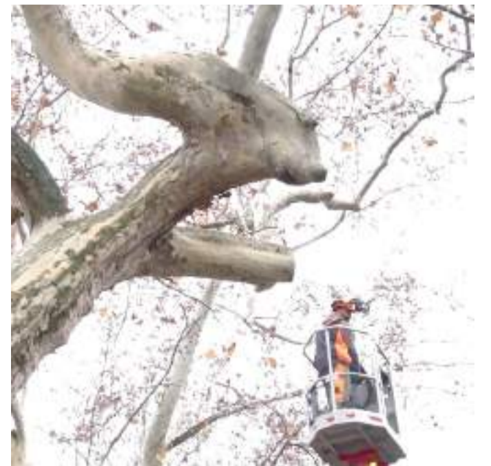
Nemrégiben levágták a Széchenyi téren álló „disznófejű” platán néhány ágát, hogy ne nehezedjen túl nagy teher a törzsére.