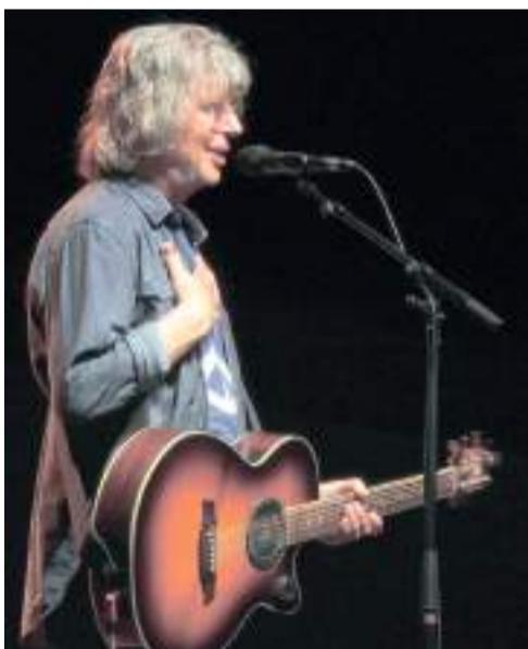
Bródy János, a magyar könnyűzene egyik legnagyobb alakja is koncertet ad Szegeden.