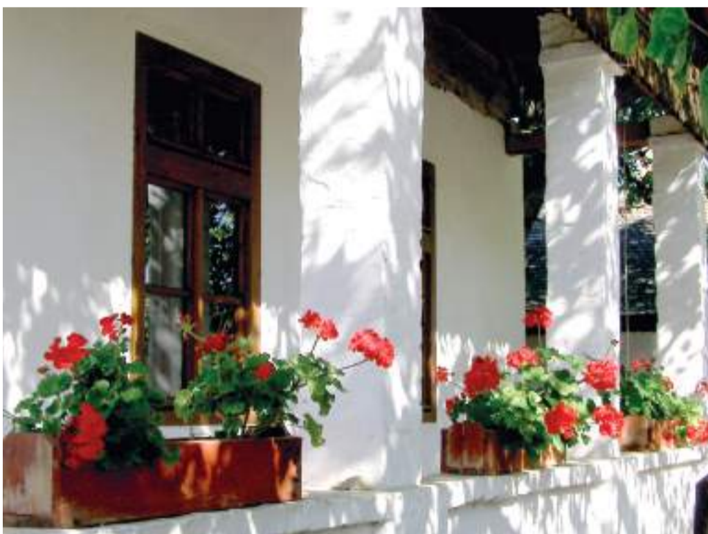
Muskátlis palóc tornác.