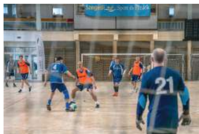
Már zajlanak a selejtezők.

– Az egész napos program elődöntőkkel és bronzmeccsekkel kezdődik, délután a döntők között lesznek a gálameccsek. Az említett csapatok kereteiben mindenki megtalálhatja az érdeklődési körének megfelelőket. Nem csak a közelmúlt legjobb magyar válogatott