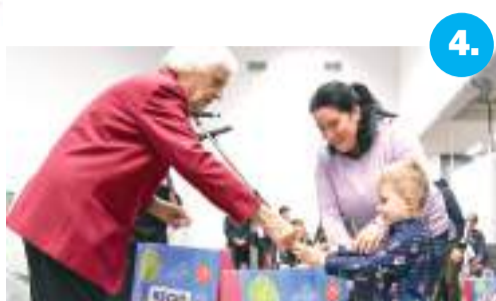
4. Toledói karácsony az Agórában