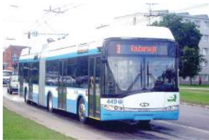
A Trollino tallinni változata.