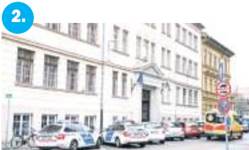
2. Egy tragédia árnyékában