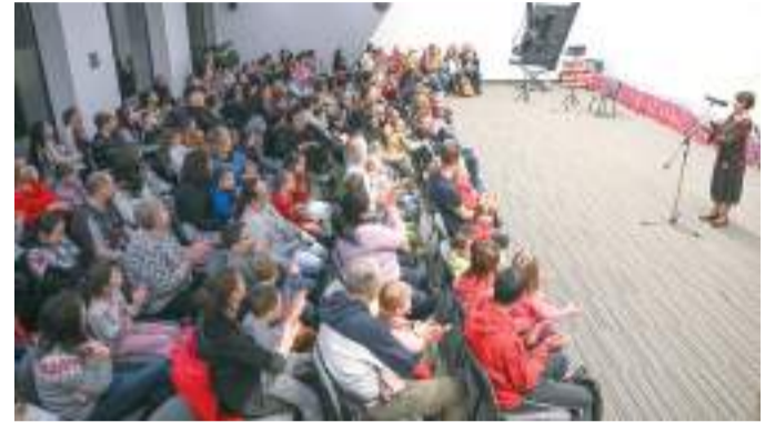
Száz szegedi gyermek kapott karácsonyi ajándékot Toledóból.

Száz szege-di gyermek kapott karácsonyi ajándékot a tengerentúlról. Szeged harmincnégy évvel ezelőtt kötött testvérvárosi megállapodást az amerikai Toledóval, ahol sok, egykor kivándorolt magyar család leszármazottja él. A toledói közösség magyar iskolát és klubot is működtet a mintegy háromszázezer lakosú amerikai