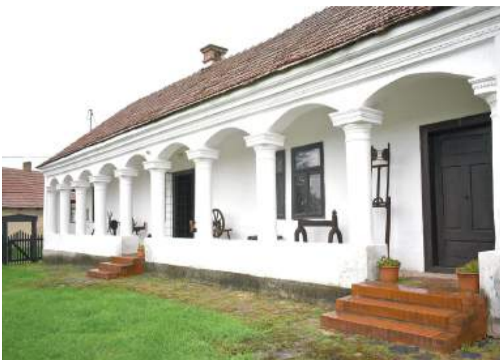
Tornác Edelényben.