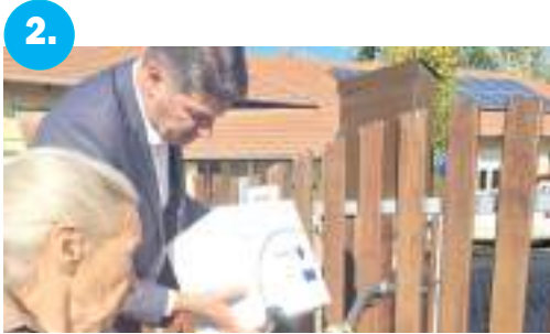
2. Nyomoznak a túlárazott élelmiszerek miatt