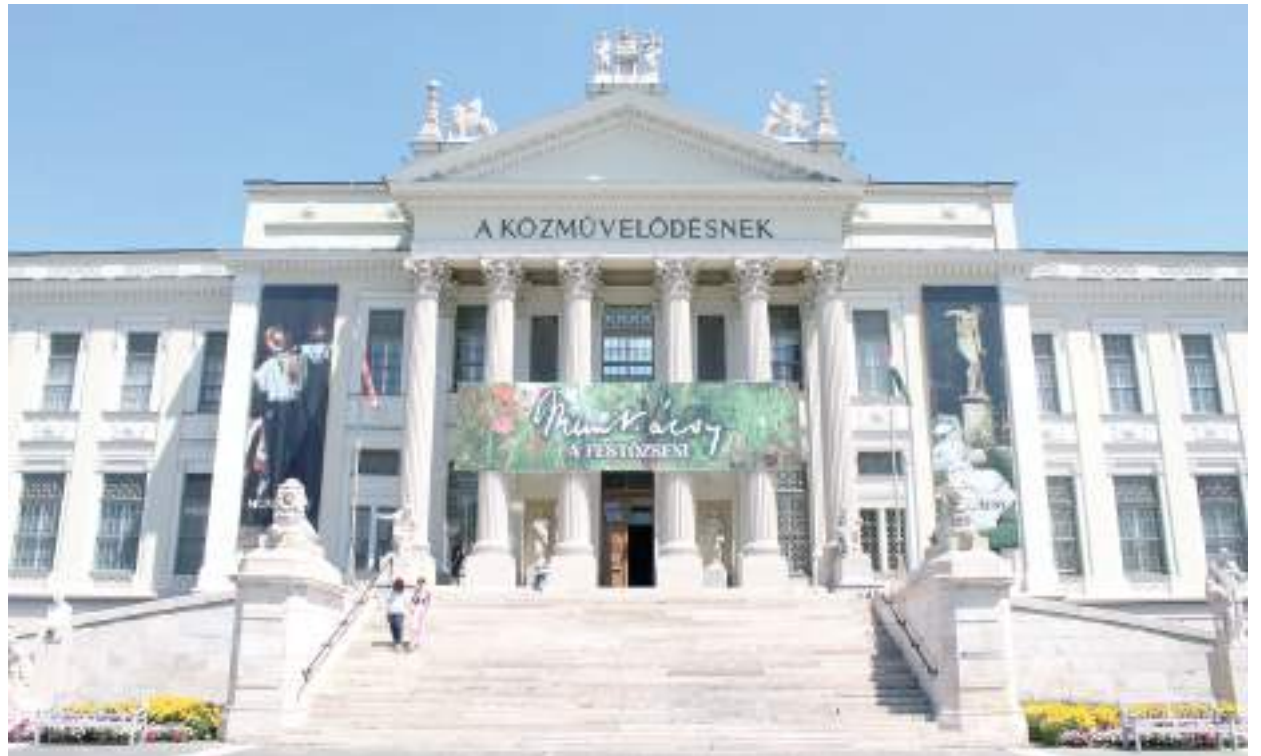
A nagy érdeklődésre való tekintettel a szegedi kiállítást február 2-ig meghosszabbították.

rendezték tiszteletére. A New York-i magyarok mindjárt az elején kitétek magukért: november 23-án a Delmonico étteremben tartott estélyen Pulitzer látta el a szertartásmester szerepét, s ő mondta az üdvözlőbeszédet. Az ünnepélyes eseményen a magyar emigráns közösség tagjain kívül illusztris vendégsereg jelent meg: lapszerkesztők, politikusok, a kulturális élet, az üzleti és pénzügyvilág reprezentánsai, továbbá más, ismert közéleti személyiségek. Az óhazát az osztrák-magyar alkonzul képviselte. A magyar és amerikai zászlókkal ékesített terem falán az „Isten