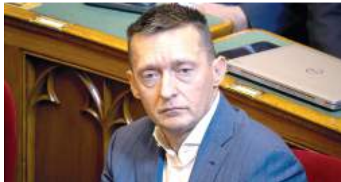
Rogán Antal propagandaminiszter.

Kormánypropagandára a tervezettnél 18,1, rendezvényekre pedig 35,5 milliárddal költött többet a Rogán Antal vezette Miniszterelnöki Kabinetiroda 2023-ban – írta az mfor.hu.