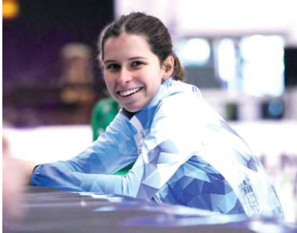
Mosolygósan vághat neki a nemzetközi szezonnak a szegedi klasszis.

Jászapáti azt is elárulta, hogy a nemzetközi szövetség az előző szezon végén egy új kezdeményezéssel állt elő, ezért minden nemzetnek kabalaál-