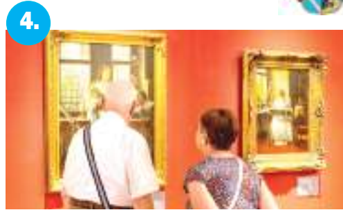
4. Meghosszabbították a Munkácsy-kiállítást