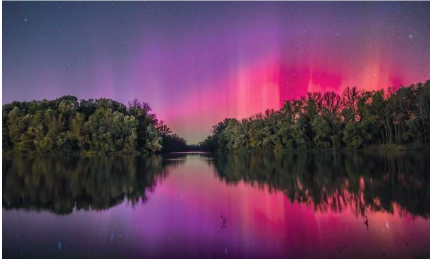
Sarki fény a Körös-torokban.