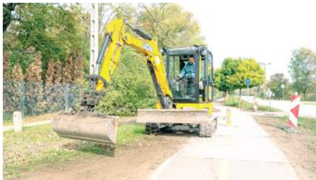
November végéig felújítják a Pihenő utca Lomnici utca és Erdőszéli utca közötti szakaszát.

Önkormányzati forrásból újult meg idén a Tavasz utca, a Fő fasor, a Selmei és a Zólyomi utca, a Rókusi körút, a Vedres és a Csanádi utca. Folyamatban van az Eperjesi sor, a Földmíves és a Sárkány utca, illetve a Somogyi utca és a Palánk tömbbelső utcáinak aszfaltcseréje.