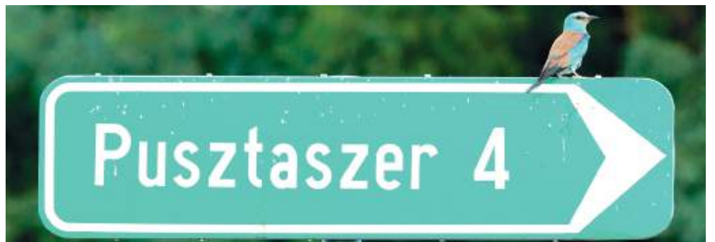
Szalakóta land.