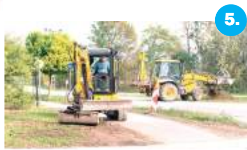
5. Felújítják a Pihenő utca egy szakaszát