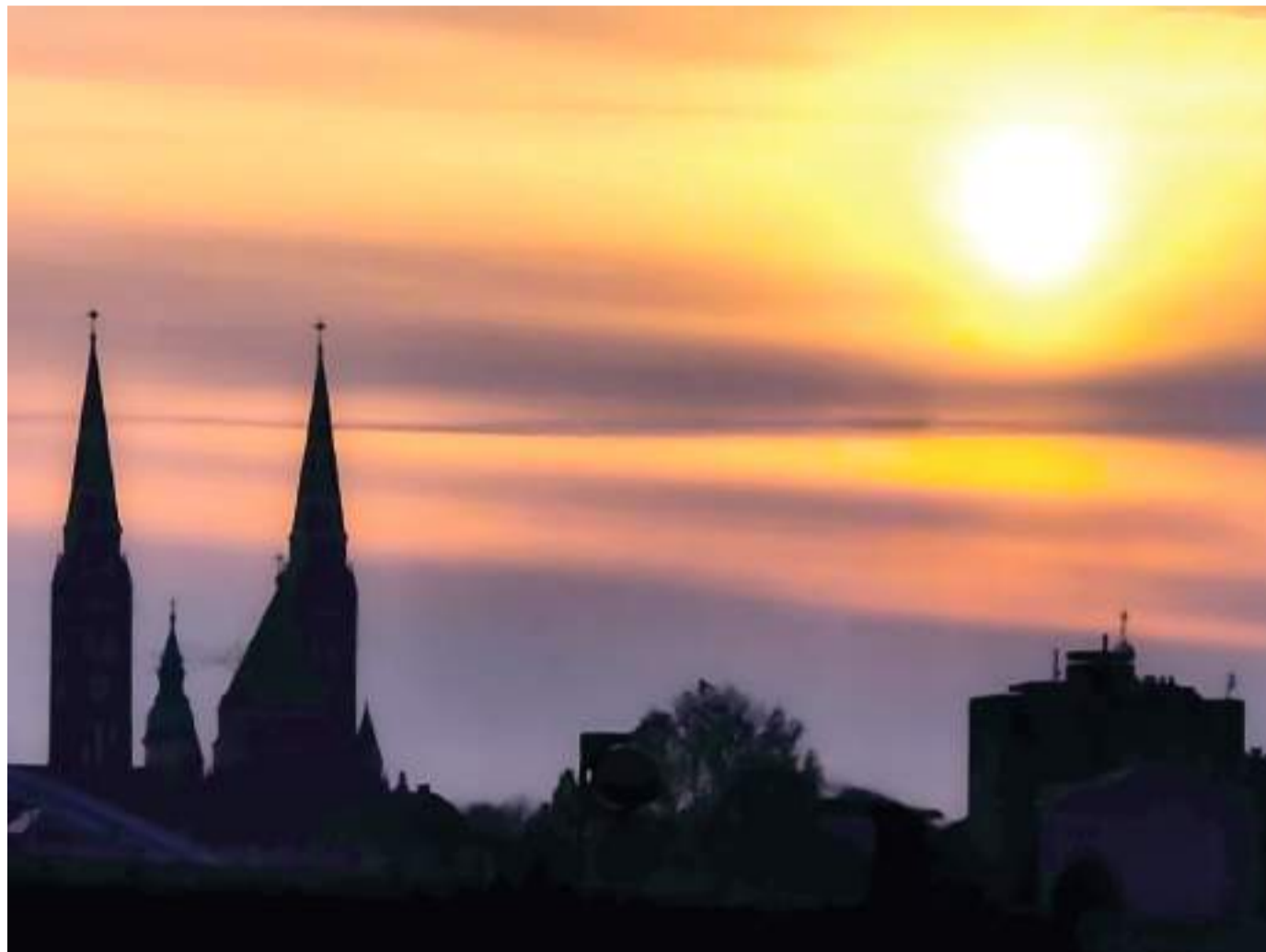
Alkony Szeged felett.