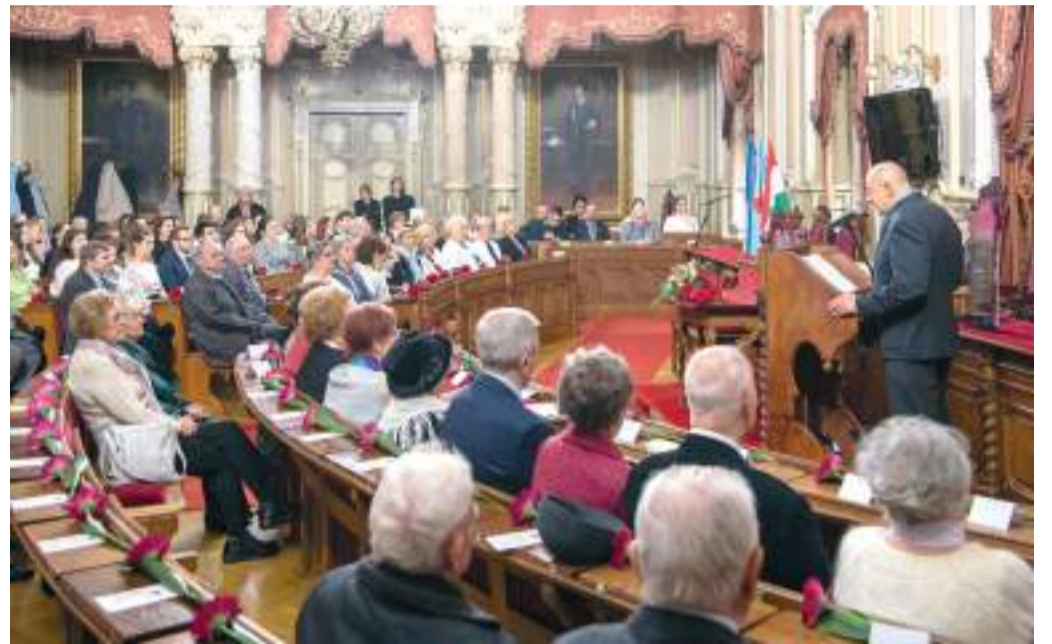
A városháza dísztermében hagyományosan, ünnepséggel köszöntötték a kilencvenkét díszdiplomás és az ötvenhét pályakezdő pedagógust.

Az alpolgármester arról is beszélt, hogy a város büszke