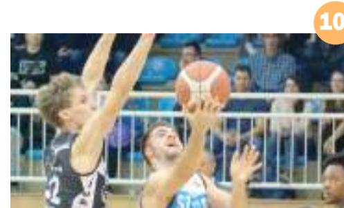
10. Szurkolói segítséggel nyert a Szedeaák