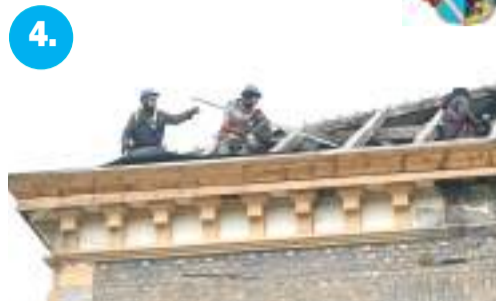
4. Új tetőt kap a Huszár utcai irodaépület