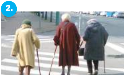
2. Átverik a nyugdíjasokat a statisztikákkal