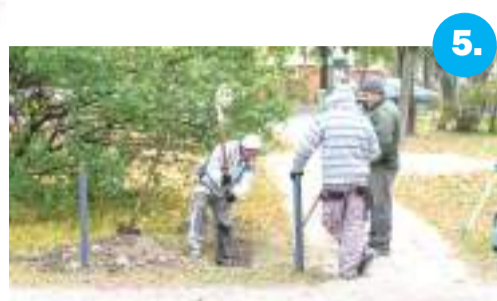
5. Felújítják a Retek utcai tömbbelső