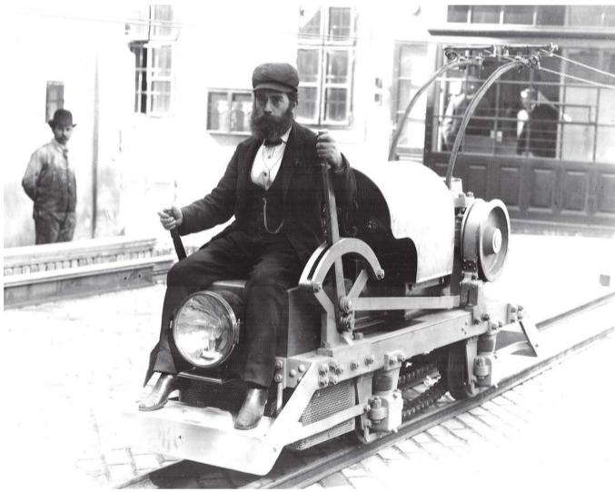
Ez a Ganz-gyártmányú villamos vontató a Bleiberger Bergwerks Unionnak készült. Az ausztriai Bleiberg történelmét túlnyomórészt a helyi ólom- és cinkbányászat alakította.

ezen a mozdonyok merre járnak, hogy néz ki a magyarországi munkájuk. Vasúti fórumok hozzászólásai-ból kiderült, hogy létezik egy előttem teljesen ismeretlen közösség Magyarországon, a vasútbarátoké. Ők azok, akik a leghetlenebb időpontban, akár éjjel, fagyban, hóesésben várnak a sínek mellett egy ritka vonatot, rajonganak értük, gyűjtenek a talpfatellitetségi-jelző szög-től a vasutas parolikon át a kéregjegyekig sok mindent. Viszont nem volt közös megjelenési fórumuk. Nekik hoztam létre még Szegeden az Indóházat, és bevontam őket a szerkesztésbe, mert bevallom, annyira, ahogy ők értenek a vasúthoz, én sosem fogok, nem is vagyok vasúti szakember, inkább szerkesztő-menedzsernek tartom magam – mondta a kezdetekről Hámori Ferenc. – Nagyon sokat segítettek az első években, hogy megvethessük a lábunkat a sajtópiacra. A portfólió pedig folyamatosan bővült: több nyomtatott kiadványunk