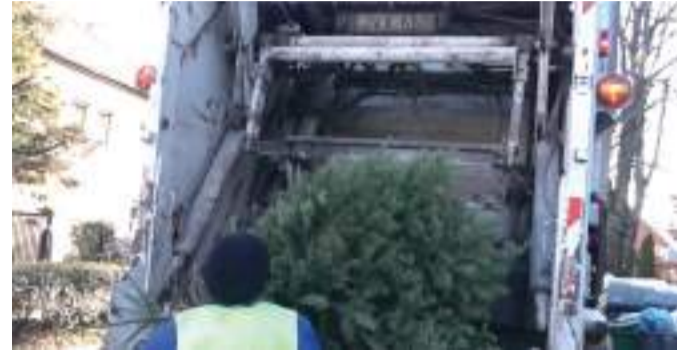
Díjmentesen viszik el a kidobott fenyőfákat, amelyeket mulcsként hasznosítanak.

Szegeden az elmúlt évekhez hasonlóan idén is megszervezték a fenyőjáratot. Január 25-éig szállítják el a kidobott fákat, amelyekből mulcsot készítenek, így hasznosulnak a város parkjaiban.