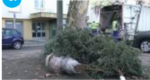
Január 25-ig viszik el a kidobott fenyőket