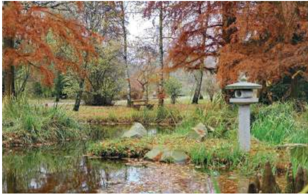
Ősz a japánkertben.

Matthew McConaughey könyve semmiképpen sem hagyományos életrajzi mű. A kendőzetlen, nyers őszinteség kéz a kézben sétál a könyv lapjain a szerelmi vallomás emelkedett líraiságával.