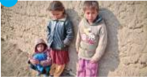
Magyarország az EU legszegényebb országa