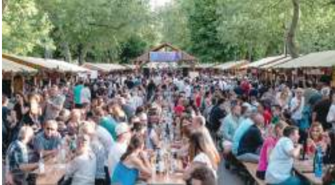
Idén is tizenegy napos lesz a szegedi borfesztivál.

M egkezdtek az idei szegedi borfesztivál, illetve a Szeged napja ünnepségsorozat szervezését – adta hírül Facebook-oldalán a Szegedi Városcéplés és Piac Kft. Azt írták, hogy a tavalyi évhez hasonlóan 2025-ben is tizenegy napos lesz a borfeszt, a Gasztroudvar és a Kincstér, amit május 15. és 25. között rendeznek meg a Széchenyi, a Klauzál és a Dugonics téren. A Dóm téri Kavalkád május 23-tól 25-ig tart, míg a 24. Hídi vásárt május 24-én és 25-én rendezik meg.