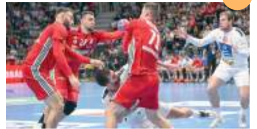
Elkezdte a vb-t a válogatott