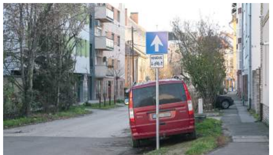
Hamarosan leszerelik a táblát, mert újra kétirányú lesz a Dankó Pista utca.