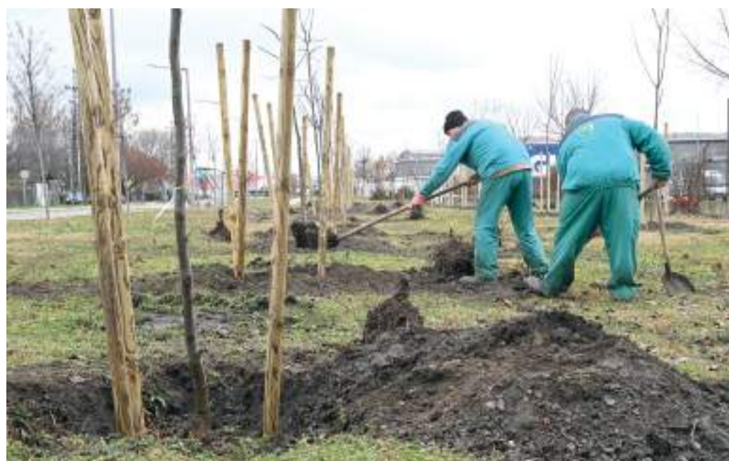
A száraz városi klímát jól tűrő fafajokat ültettek ősszel a Kollégiumi úton. A fatelepítés fontos része a Zöld város programnak.