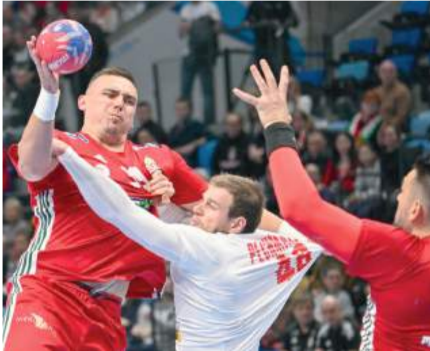
Bodóék a szegedi főpróba után már Varasdon bizonyíthatnak.

Chema Rodríguez szövetségi kapitány csapata azóta megkezdte a horvát-dán-norvég közös rendezésű tornát, a csoportkörben lapzártánk után letudta az Észak-Macedónia, a Guinea és a Hollandia elleni meccseket. Mivel a szintén varasdi középdöntőbe az első há-